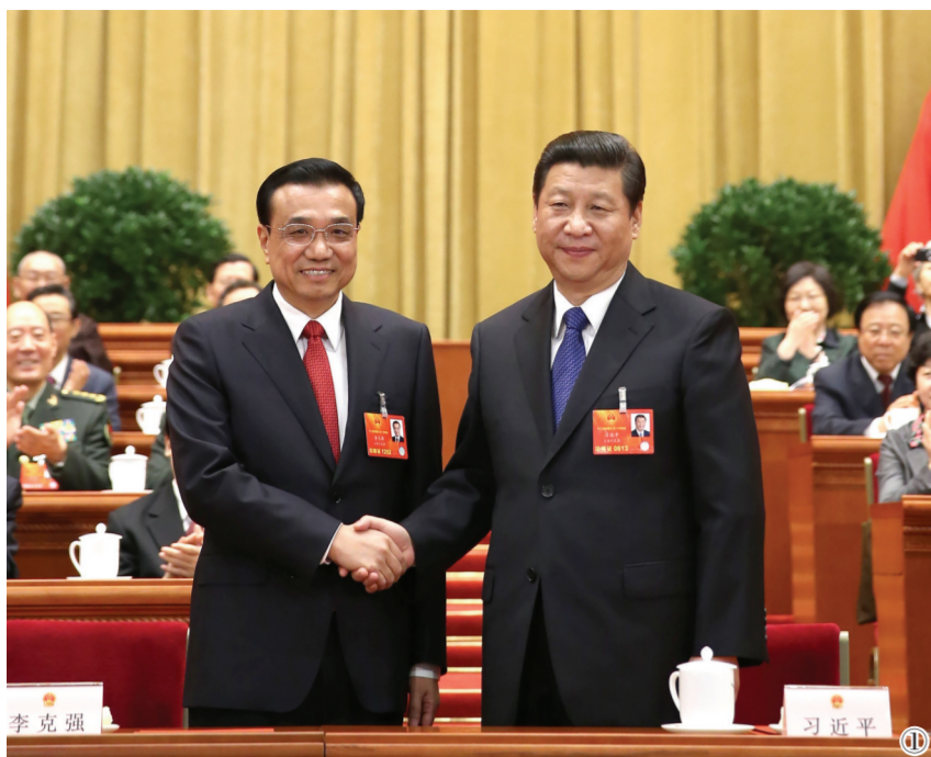
图①：2013年3月15日，第十二届全国人民代表大会第一次会议在北京人民大会堂举行第五次全体会议。会议经过投票表决，决定李克强为中华人民共和国国务院总理。这是习近平同志和李克强同志亲切握手。