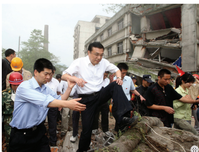
图⑧：2008年5月19日，李克强同志在四川地震灾区察看灾情。

中国共产党的优秀党员，久经考验的忠诚的共产主义战士，杰出的无产阶级革命家、政治家，党和国家的卓越领导人，中国共产党第十七届、十八届、十九届中央政治局常委，国务院原总理李克强同志，因突发心脏病，经全力抢救无效，于2023年10月27日0时10分在上海逝世，享年68岁。