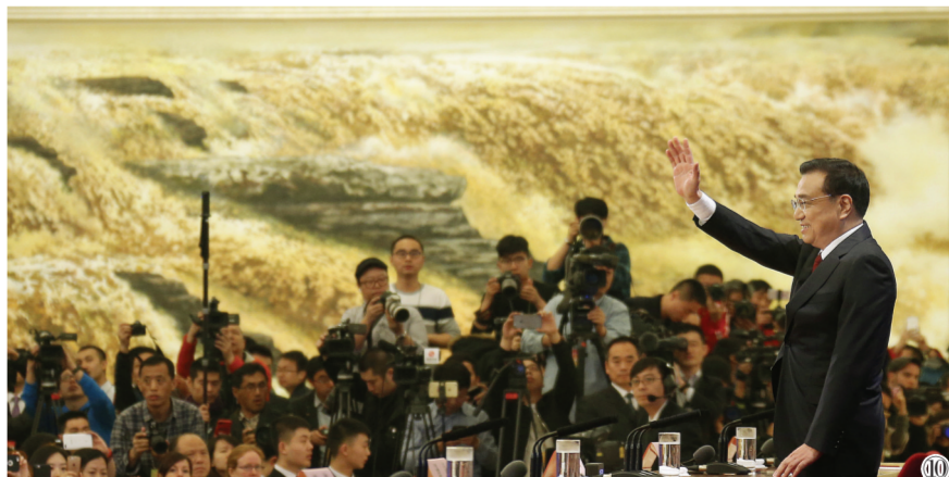
图⑪：2016年3月16日，李克强同志在北京人民大会堂与中外记者见面，并回答记者提问。