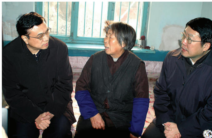
图⑤：2004年12月26日，李克强同志到辽宁省抚顺市英地沟棚户区居民王淑贞家中走访调研。