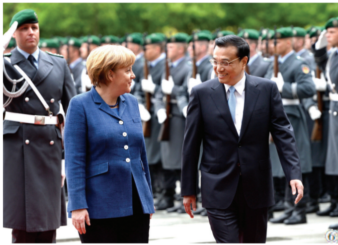
图⑥：2013年5月26日，李克强同志在柏林出席德国总理默克尔举行的欢迎仪式。