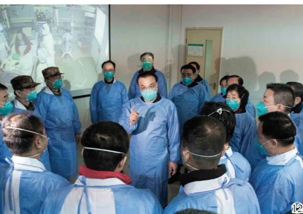
图⑫：2020年1月27日，李克强同志赴湖北省武汉市考察指导疫情防控工作，代表党中央、国务院慰问疫情防控一线的医务人员。