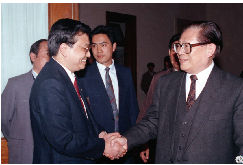
图②：1993年5月3日下午，中国共产主义青年团第十三次全国代表大会在北京人民大会堂开幕。在5月3日上午的预备会议后，举行第一次主席团会议，推选李克强等同志为主席团常务主席。这是江泽民同志与李克强同志握手。