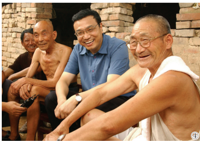
图④：2003年8月8日，李克强同志在河南省新乡市调研。这是李克强同志在原阳县桥北乡马庄村与村民亲切交谈。