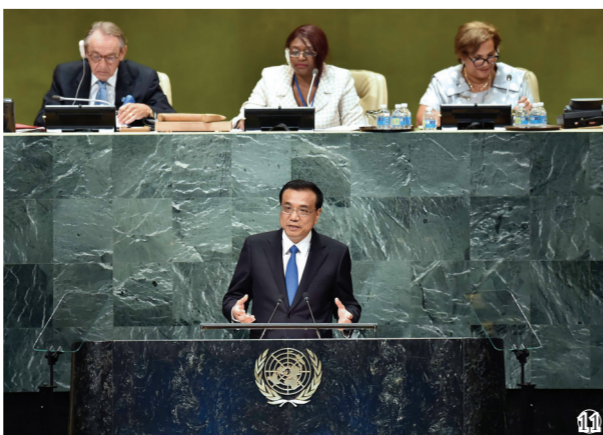
图⑩：2016年9月21日，李克强同志在纽约联合国总部出席第71届联合国大会以“可持续发展目标：共同努力改造我们的世界”为主题的一般性辩论并发表题为《携手建设和平稳定可持续发展的世界》的讲话。