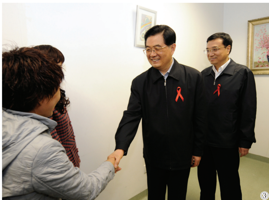
图③：2008年12月1日是第21个世界艾滋病日。胡锦涛同志和李克强同志来到北京地坛医院考察艾滋病防治工作。