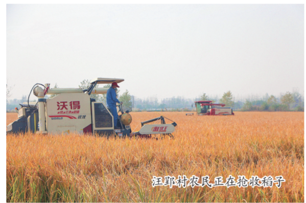
汪郢村农民正在抢收稻子

现代农业蓬勃发展。双庙村八湾现代农业休闲观光示范园流转土地400亩，发展特色水果种植，流转水面600亩，栽观赏莲花40亩，整治标准鱼塘400亩，今年将初现成效，智慧农业已初步应用。