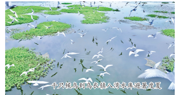
千只候鸟到乌衣镇八湾水库避暑度夏

生态环境持续改善。持续开展“三查一治”环境问题整改工作，组织城管、市场监管、应急等部门开展综合执法，持续开展散乱污企业整治，共打击取缔“散乱污”沙石加工点8处，完成3家小散乱污企业的关停取缔。开展官塘沟沿线水污染治理工作，开展常态化巡查，组织各类检查超40次，完成市民举报环境污染问题的整改5项，全面清除村居积存建筑垃圾143车。推深做实河湖长制、林长制，完成造林161亩。