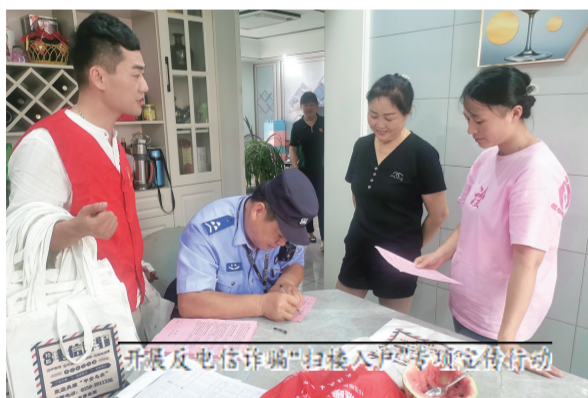
开展反电信诈骗“扫楼入户”专项行动

扎实推进“六亮”行动。在全域推进的基础上，选取15个党组织作为示范点重点培育，占比17.2%。持续推进两新领域基层党组织覆盖，新增支部7个，总结提炼优秀经验做法，打造一村（社区）一品，进一步提升基层党组织标准化规范化建设水平。高效推进信用村建设，做好党建引领信用村试点建设工作，全方位推进关键环节，截至目前已达100%。积极促进绿色金融和乡村振兴共同发展，推动双庙村和兴业银行滁州分行签订“红色合伙人”党建共建合作协议，引入金融活水。强化干部队伍建设。严格按照发展党员“十六字”方针发展党员21人，规范推荐村级后备干部8名。发挥党员作用，组织364名党员成立119个暖心服务小分队，联系服务群众2.3万户。