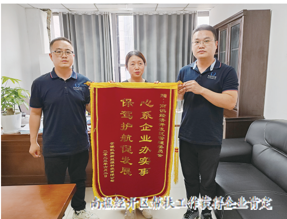
南谏经开区帮扶工作践行企业肯定

“一方土地”能不能“热”，靠纷至沓来的客商；能不能一直“热”，要靠招商亲商安商的环境。南谏经开区持续优化企业服务，要素保障精准落实，全力做好企业