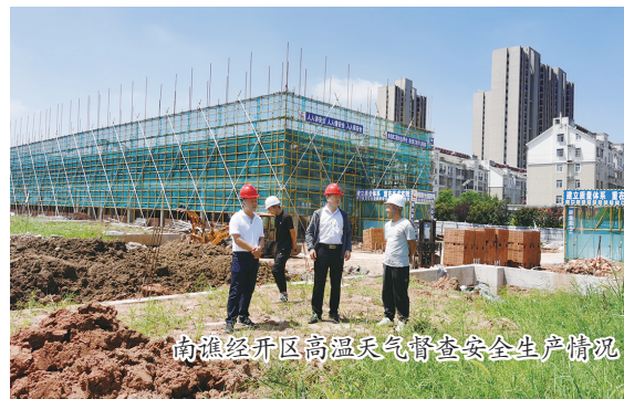
南谏经开区高温天气督促企业安全生产情况

安全生产，关乎社会大众福祉，关乎经济社会发展大局，是一条不可逾越的“红线”。一直以来，南谏经开区坚持把安全生产工作作为一项民生工程 and 底线工程来抓，园区管委会和企业共同发力，狠抓重点领域、重点行业、重点时段，通过建立健全安全生产责任体系，创新监管方法，扎实开展安全生产大检查和隐患排查治理工作，加强全员安全培训，时刻把安全生产工作抓在手上、扛在肩上、放在心上，全力确保辖区安全生产形势