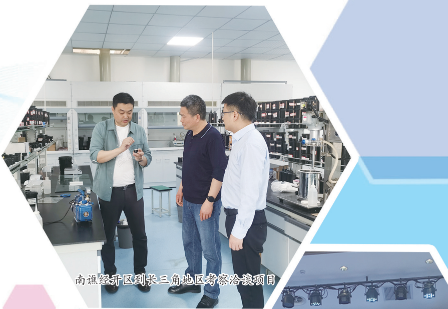
南谏经开区区长三角地区考察洽谈项目

新的征程，呼唤新的进发；新的篇章，开启新的书写。下一步，南谏经开区将以“闯”的精神，“创”的劲头，“干”的作风，推动产业集群发展，打造良好产业生态，不断优化营商环境，在高质量发展之路路上铿锵前行，在中国式现代化新征程中奋楫远航。