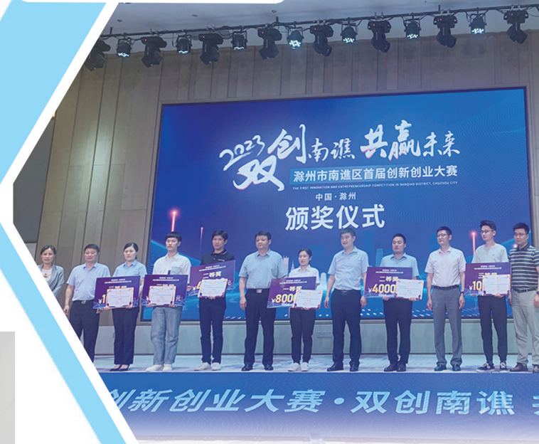
南谏经开区重点企业在南谏区首届创新创业大赛中获奖