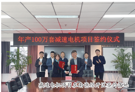
年产100万套减速电机项目签约仪式