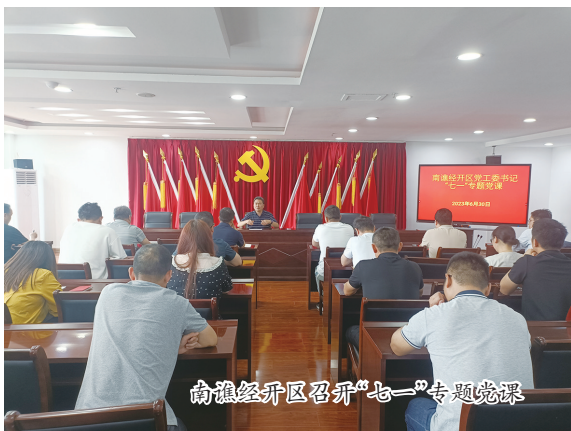
南谏经开区召开“七一”专题党课

鲜红的党旗，飘扬在每一个企业、厂房、工地上。党支部的战斗堡垒作用、党员的先锋模范作用，在每一个产业项目上熠熠生辉，焕发出强大的战斗力、生产力、推动力、凝聚力，这是经开区实施党建引领推动高质量发展结出的累累硕果。