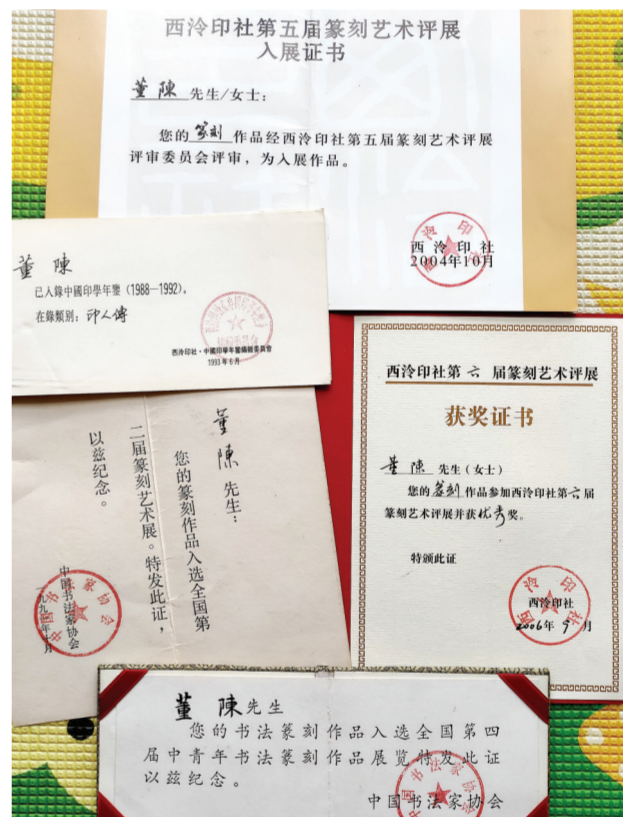
▲获得的部分荣誉证书