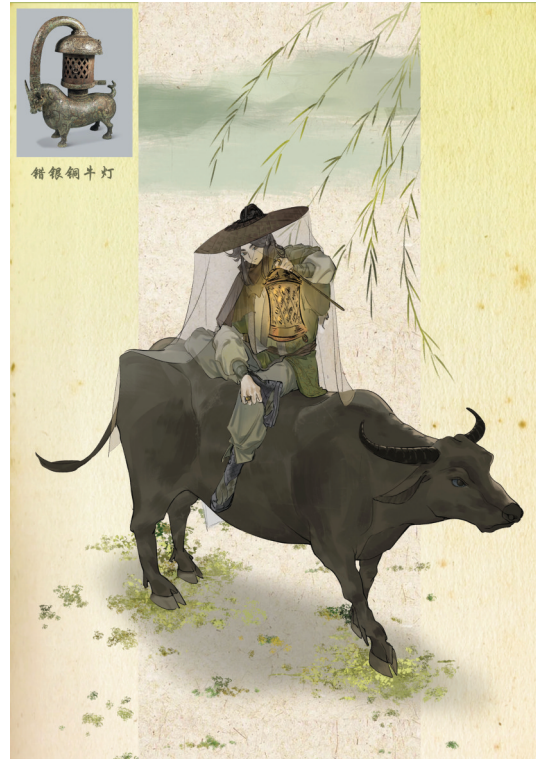
▲《弥新集》之错银铜牛灯(插画设计) 作者:许乐 白植轩 指导教师:薛梦琪