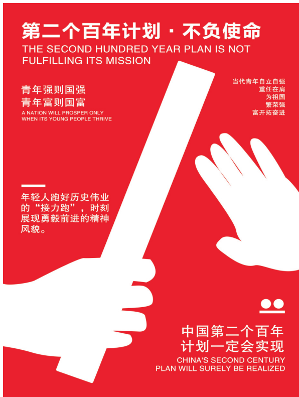
▲《第二个百年计划·不负使命》(招贴设计) 作者:周玉婷 指导教师:王晓玮