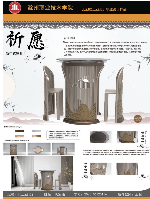
▲《祈愿》(产品设计) 作者:代紫涵 指导教师:王起