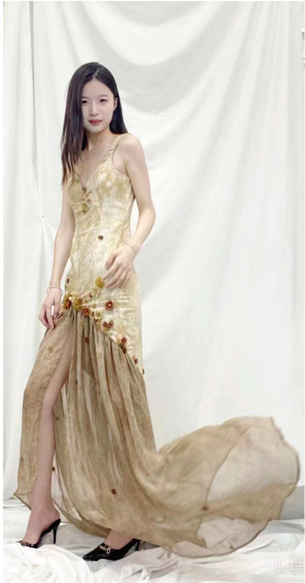
▲《锦绣人生》(服装设计) 作者:刘阿勤 指导教师:于雯雯