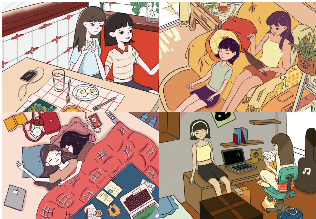
▲《相伴》(四格漫画) 作者:方思雅 指导教师:范文娟