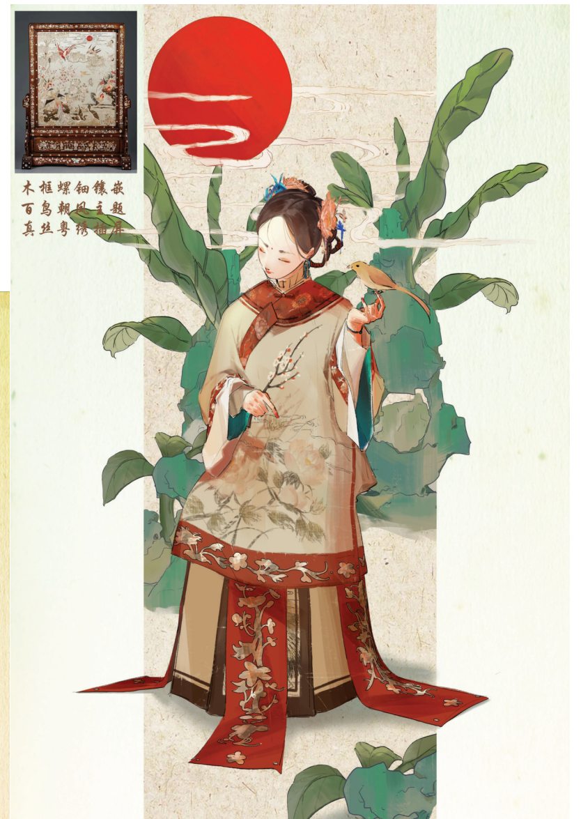
▲《弥新集》木框螺钿镶嵌百鸟朝凤主题真丝粤绣插屏(插画设计) 作者:许乐 白植轩 指导教师:薛梦琪