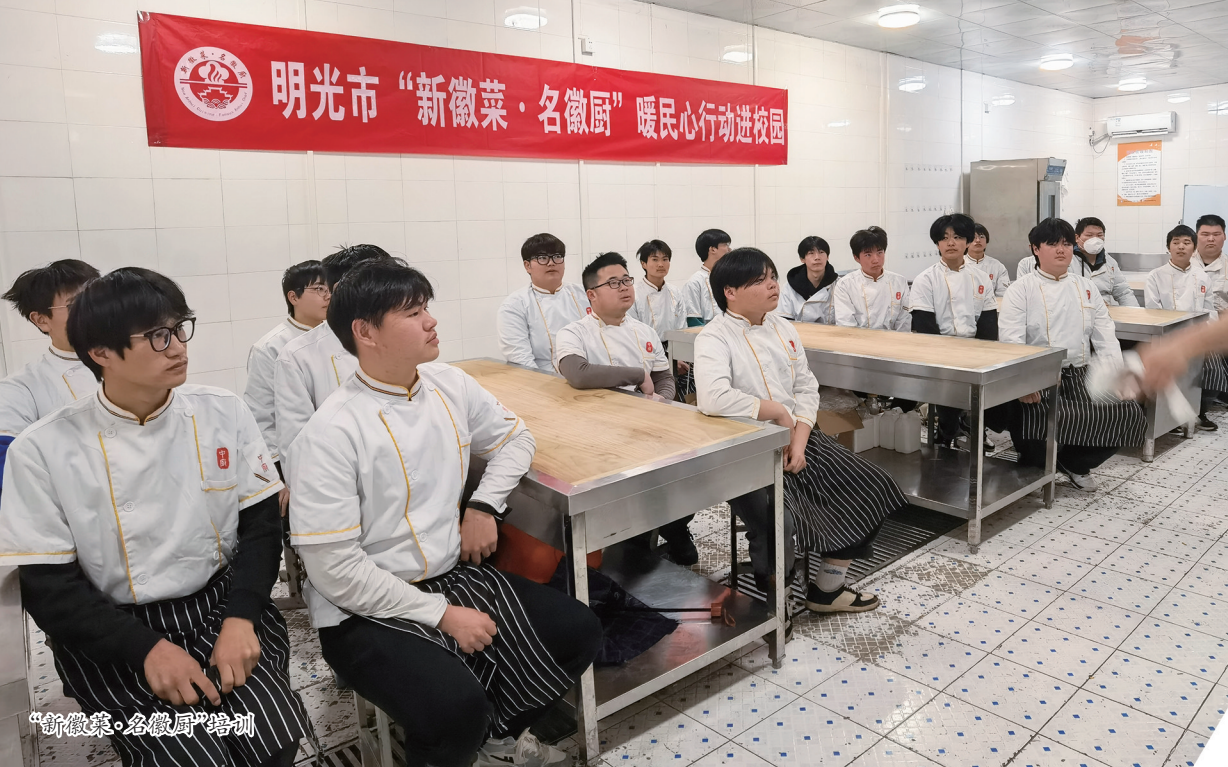
“新徽菜·名徽厨”培训

一件件实事,在琐碎中流露真情……为民生护航,让民心更暖。未来,明光市将继续大力推进暖民心行动,用小实事累积大民生,用实实在在的“民生温度”温暖民心,从而凝聚出推动全市更好更快发展的强大合力。