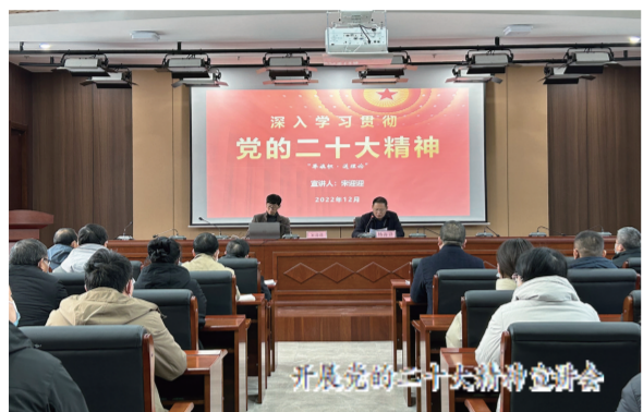
开展党的二十大精神宣讲会

近年来，市气象局以党建为引领，积极探索“党建+创建”模式，在文明创建工作中，全体党员冲锋在前。该局党总支先后被评为滁州市先进党组织和五星级党支部，第二支部被评为市直先进基层党组织，第一支部被纳入全省气象部门基层党建工作“领航”计划培育库。