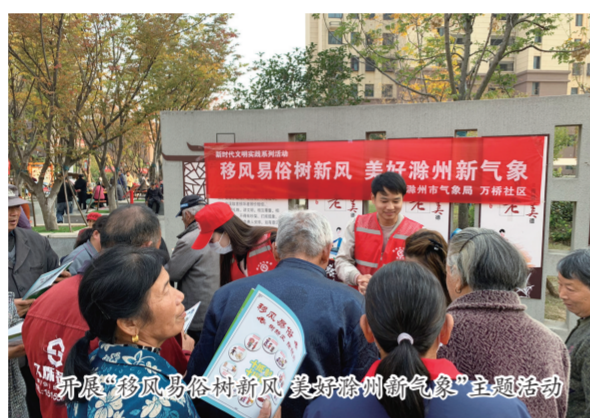
开展“移风易俗树新风 美好滁州新气象”主题活动

加强机关建设，努力营造浓厚的文明创建氛围。深入推进机关“廊、梯、厅”文化建设，结合党建、文明创建、气象文化、廉洁文化等相关主题，在每个楼层设置不同的文化宣传展牌，并在局大院制作新时代公民道德建设实施纲要等公益广告牌宣传栏。同时，大力倡导绿色环保的生活方式，积极营造优美舒适的办公环境，先后获评国家级节约型机关、安徽省卫生先进单位、滁州市花园式单位、滁州市无烟单位。