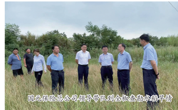
国元保险总公司领导带队到会检查水车节水情况

今年7月份以来，持续多日的高温天气，全市频频出现高温预警，降水量较常年同期显著偏少。曾经郁郁葱葱的农作物正在焦渴中等待雨水，目光所及之处，成片玉米、水稻干枯发黄，秋粮受旱面积每天都在扩大。灾情当前，国元保全公司之力抗旱救灾，成立了24个查勘小组赶赴各个乡镇查勘，积极开展抗旱减损工作，并尽最大可能减少损失，投放抗旱减损物资60万元，与气象局联合开展人工增雨作业，并捐赠50万元。