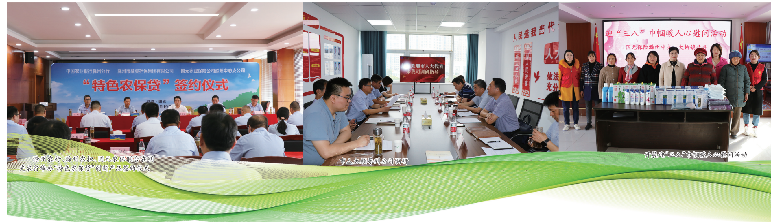
滁州农行、滁州农担、国元农保联合在明光农行举办“特色农保贷”创新产品签约仪式