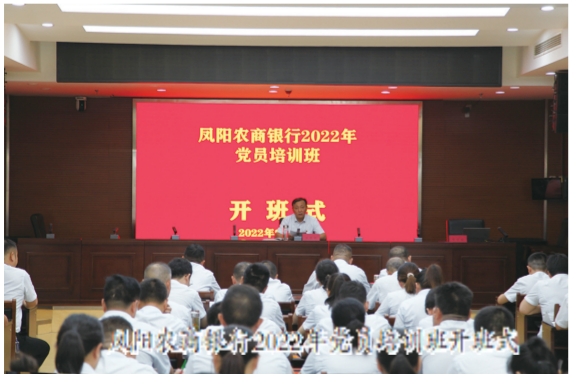
凤阳农商银行2022年党员培训班开班式

建强党建“大堡垒”。为坚决落实党组织“把方向、管大局、保落实”领导作用，该行持续加强基层党组织建设，制定印发《凤阳农商银行2022年度基层党建工作“三个清单”》。持续做实思想建设，深入学习宣传贯彻党的二十大精神，深入推动党史学习教育常态化长效化。今年以来，党委理论学习中心组先后召开15次扩大研讨会，及时召开了党史学习教育专题民主生活会及“两优一先”表彰大会。持续推动党建与群团工会深度融合，先后开展春节、七一、走访慰问活动，积极开展退伍军人座谈会、“农金心向党，喜迎二十大”首届职工运动会。2021年以来先后有三个支部被省联社列入领航计划“培育库”及“一支部一品牌”。