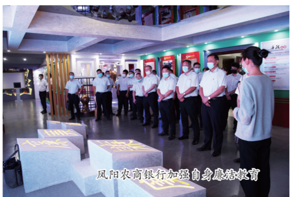
凤阳农商银行加强自身廉洁教育

压实责任，管理提升。加强政策宣导，对主要股东实施动态监测，落实台账登记，强化交易管理。持续优化股权结构，积极引入优质股东，清退不符合股东资质的股东，并严格对新人股东入股资金来源及股东资质的审核。年初以来，共变更股权44笔，金额2020.17万元，其中，清退不符合股东资质要求的股东14名，引入优质投资者10名。