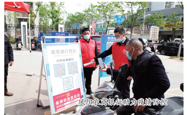
凤阳农商银行助力疫情防控