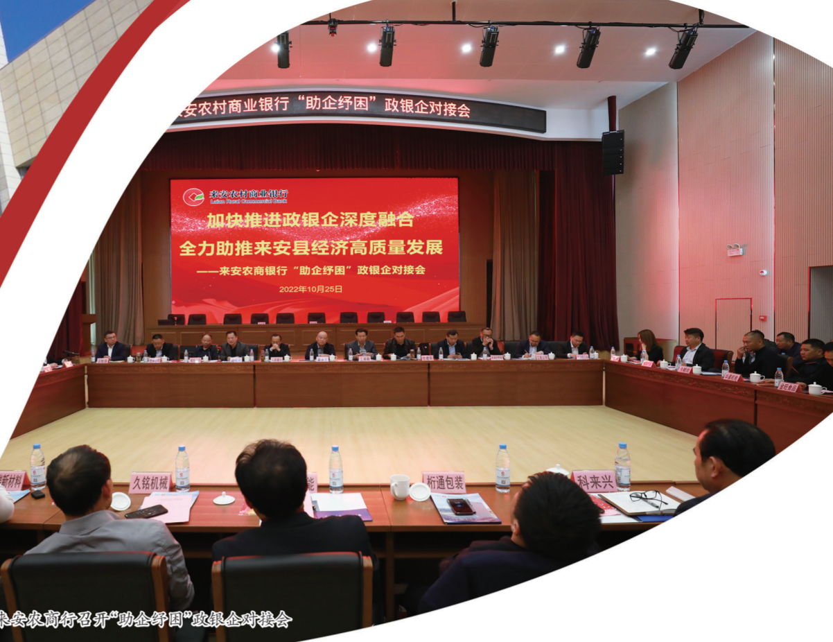
来安农商行召开“助企纾困”政银企对接会