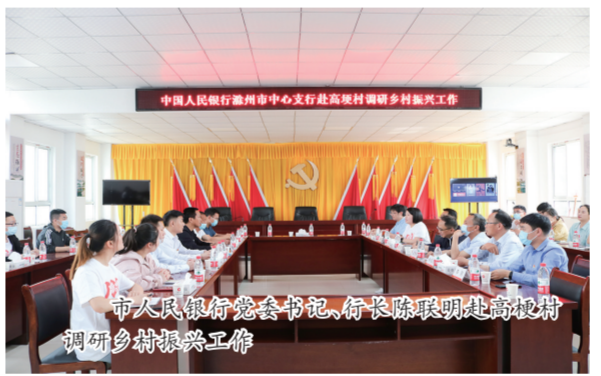
市人行党委书记、行长陈联明赴顶山—双河宿松地区调研乡村振兴工作

在3月31日的发布会现场,人民银行滁州市中心支行创新推出“碳碳易”绿色减排再贴现产品,支持金融机构为具有显著碳减排效应的企业提供优惠利率的票据融资,助力“双碳”战略落地。该行先期单列20亿元专项额度予以保障,并与中信银行滁州分行签约办理了首批“碳碳易”绿色减排再贴现业务,共102笔,金额1.03亿元,平均利率仅2.14%。