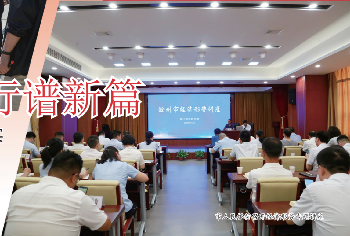
市人行组织召开经济形势专题讲座

今年以来,人民银行滁州市中心支行坚持以习近平新时代中国特色社会主义思想为指导,围绕进入新发展阶段、贯彻新发展理念、构建新发展格局、推动高质量发展,组织动员全市金融行业干部职工通过劳动技能竞赛活动,优化金融服务保障,提高金融服务实体经济质效,推动落实“金融为民、金融惠民、金融利民”。