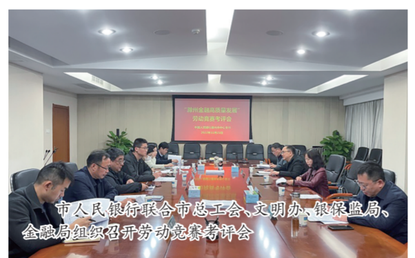
市人行联合市总工会、文明办、银保监局、金融局组织召开劳动竞赛总结会

此次竞赛是在疫情防控常态化背景下举行的,也是贯彻习近平总书记有关统筹疫情防控和经济社会发展工作的重要讲话精神一次实践活动,是贯彻落实上级人民银行和滁州市委市政府重大决策部署的有力举措。市人行主动担责,积极履行牵头抓总的职责,引导广大金融行业干部职工借助本次竞赛平台,聚焦目标任务,瞄准竞赛重点,精准对接龙头企业、转型产业、“双招双引”建设项目,奋力