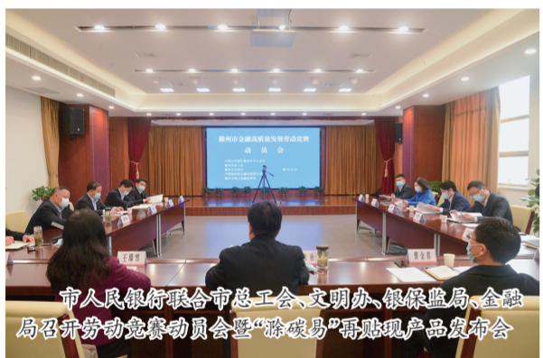
市人行联合市总工会、文明办、银保监局、金融局召开劳动竞赛动员暨“碳碳易”再贴现产品发布会

3月31日,中国人民银行滁州市中心支行联合市总工会、市文明办、市银保监分局、市金融监管局组织召开“滁州市金融高质量发展”劳动竞赛动员暨“碳碳易”再贴现产品发布会。全市市直银行业金融机构主要负责人参加了会议,人民银行各县(市)支行、县域地方金融组织通过电视电话会议参会。现场宣读了“滁州市金融高质量发展”劳动竞赛实施方案。