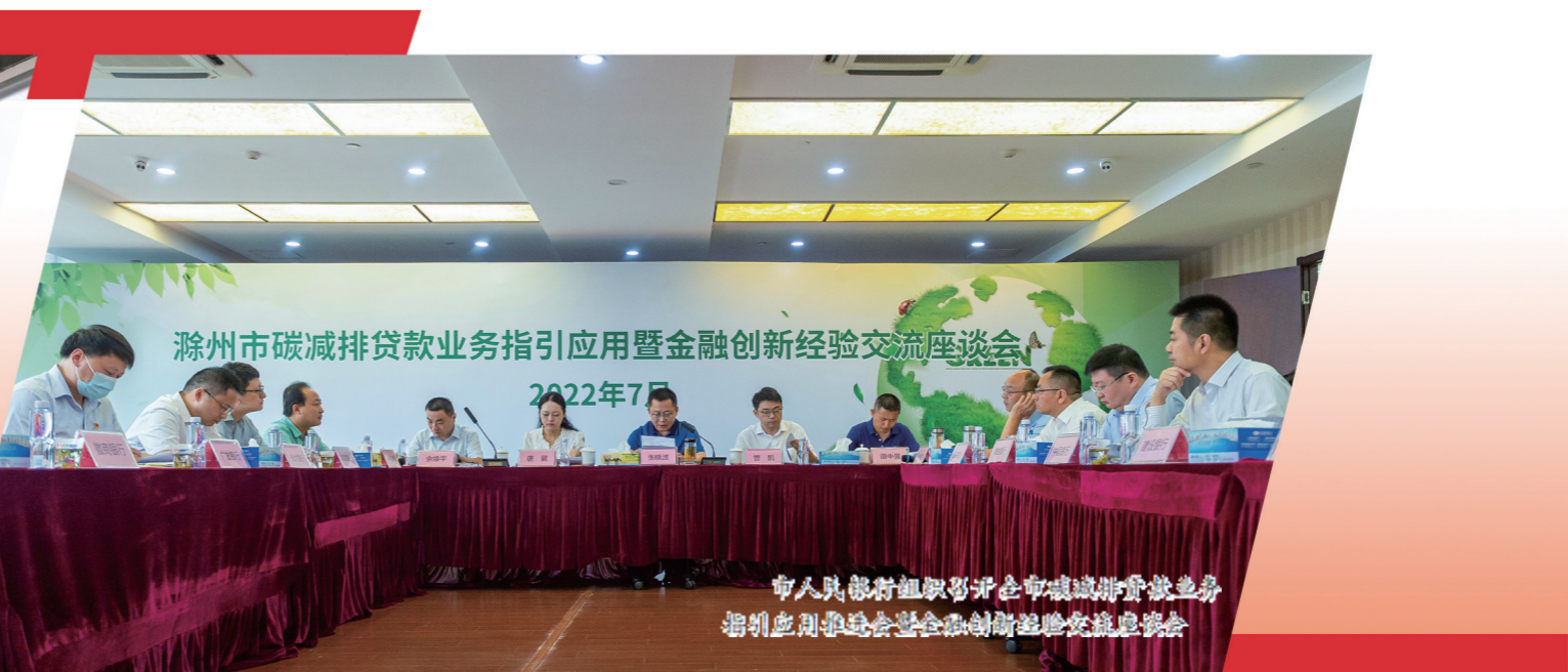
市人行组织召开全市碳减排贷款业务指引应用暨金融创新经验交流座谈会