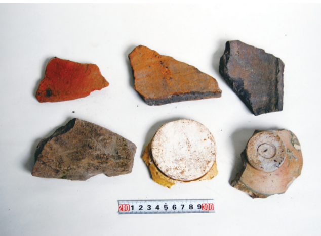
阜梁古城遗址出土的文物标本。

前545),棠属吴国,其间发生楚国子囊伐吴,至棠,吴人避战,楚军折返时在“皋舟之隘”(位于今全椒县滁河段)遭到吴人伏击而战败的事件。周元王三年(公元前473)棠属越国。显王十四年(公元前355)棠属楚国。秦时建棠邑县,汉武帝时改为棠阳县。隋时改为六合县。明清民国时期,来安县的施官、雷官、大英等集镇均属六合。