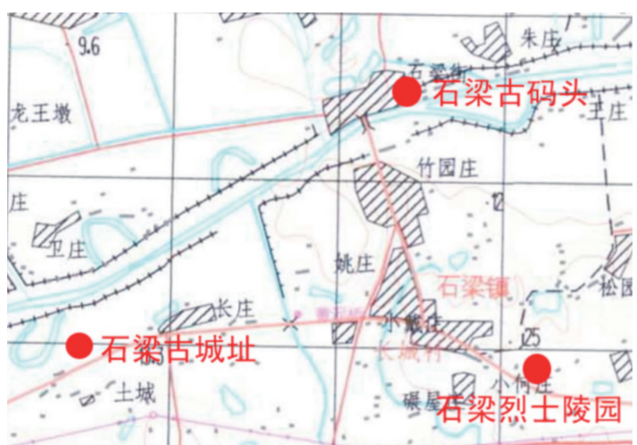
阜梁(石梁古城址)位置图。

“伍胥惧,乃与胜俱奔吴(都城在今江苏苏州)。到昭关,昭关欲执之。伍胥遂与胜独身步走,几不得脱。追者在后。至江,江上有一渔父乘船,知伍胥之急,乃渡伍胥。”民间也有这样的传说,伍子胥带着公子胜逃出郑国,投奔吴国。楚平王早就下令悬赏捉拿伍子胥,叫人画了伍子胥的像,挂在楚国各地的城门口,嘱咐各地官吏盘查。伍子胥带着公子胜逃出郑国后,白天躲藏,晚上赶路,来到吴楚两国交界的昭关。关上的官吏盘查得很紧。伍子胥不能过关,愁得睡不着觉,一夜白了头。幸亏他们遇到了一个好心人东皋公,同情伍子胥,把他接到自己家里。东皋公有个朋友,名叫皇甫讷,模样有点像伍子胥。东皋公让他冒充伍子胥过关。守关的逮住了这个假伍子胥,而那个真伍子胥因为头发全白,面貌变了,守关的认不出来,就被他混出关去。