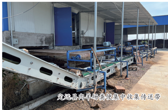
定远县肉羊场粪便集中收集传送带

2018年以来，先后在8个县（市、区）实施整县推进项目，实现畜禽粪污全域治理。并连续三年实施商品有机肥推广应用试点项目。通过项目建设彻底解决了1350个规模养殖户粪污处理问题，每年资源化利用畜禽粪污362万多吨，畜禽粪污综合利用率实现历史性突破，畜禽养殖废弃物资源化利用工作走在了全省前列。