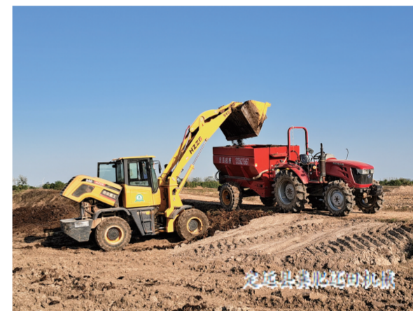
定远县粪肥还田的场景

为打通粪肥还田“最后一公里”问题，天长市探索建立天长市畜禽养殖废弃物资源化利用常态化运行机制，政府鼓励养殖场（户）与第三方处理企业签订购买服务合同，并根据粪肥处理量按每吨20元予以第三方处理企业补助，通过第三方集中处理达到资源化利用。不同于天长，定远首先是让生猪“粪污”变“粪肥”，实现废弃物角色转化，其次让生猪养殖场（户）主动参与、积极实施粪污设施改建，再次让规模种植户因肥增效，实现使用粪肥热情高涨，成为生猪粪肥施用的主力军；最后社会化服务组织或有机肥生产企业，“收费”变“付费”，实现粪肥利用率和有机肥质量稳步提升。