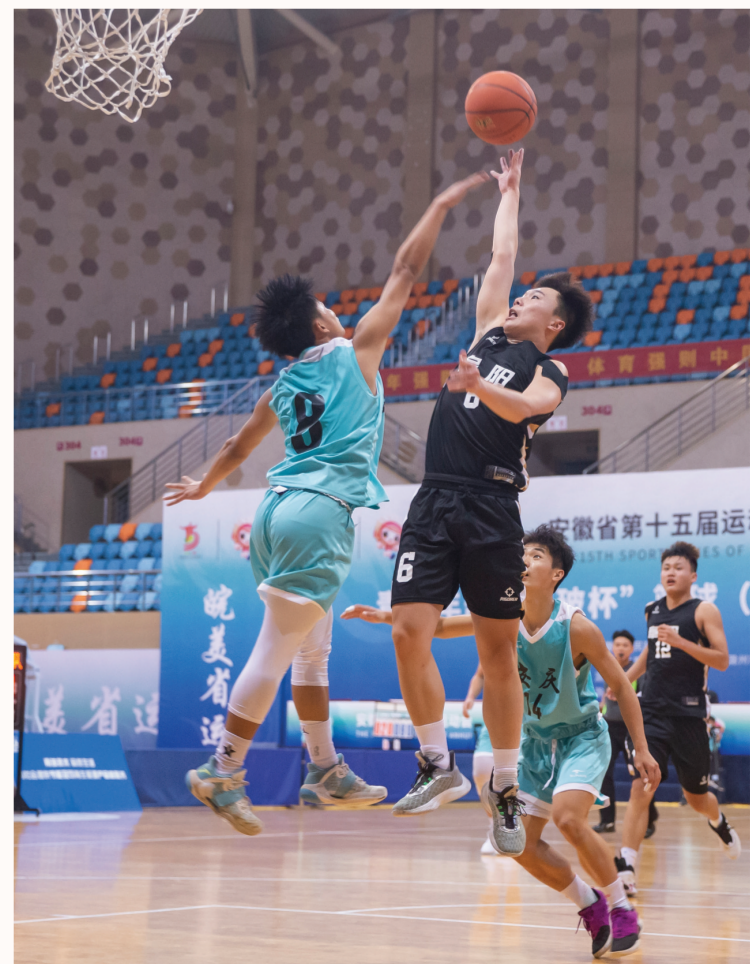
▲在青少年部篮球男子甲组比赛现场,阜阳队与安庆队进行激烈比拼