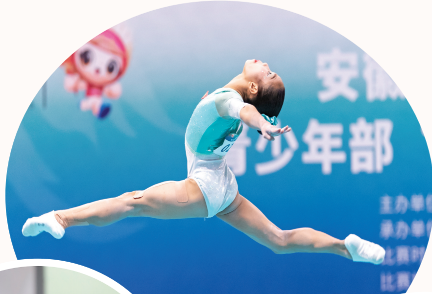
▲青少年部体操全能决赛现场