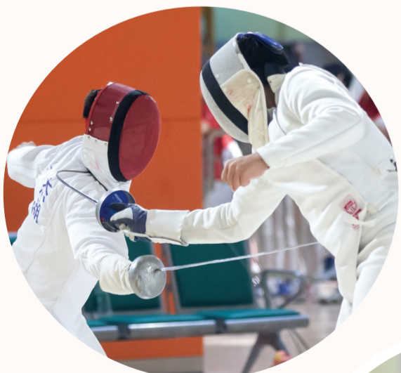
▲选手们青少年部击剑比赛中挥剑击刺