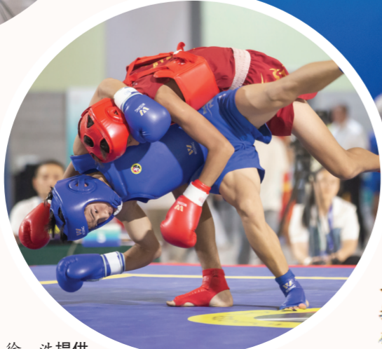
▲在青少年部武术散打比赛现场,选手们在擂台上激烈较量