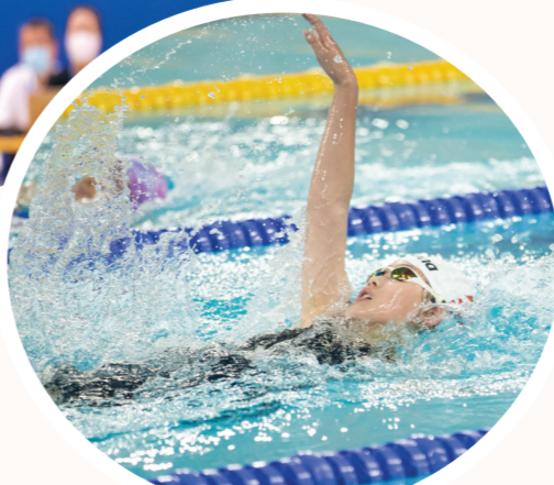
▼在奥体中心游泳馆,选手们在女子乙组200米仰泳决赛中奋力冲刺