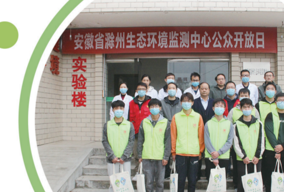
开展环保设施公众开放活动