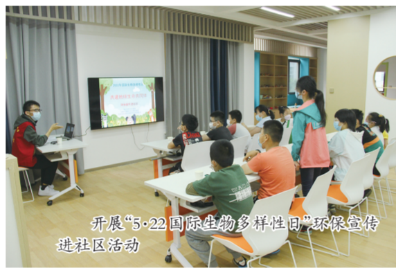
开展“5·22国际生物多样性日”环保宣传进社区活动

立足本职,开展环保主题宣传活动。坚持以志愿服务活动为契机,广泛开展绿色生活创建活动、“文明交通绿色出行”行动,倡导简约适度、绿色低碳的生活方式。该局与多家单位联合开展“6·5”环境日系列活动,牵头开展“5·22生物多样性日”活动、全国低碳日活动。坚持线上线下结合,开展“美丽中国,我是行动者”“人与自然和谐共生”等主题宣传活动,环保公众开放日活动、环保