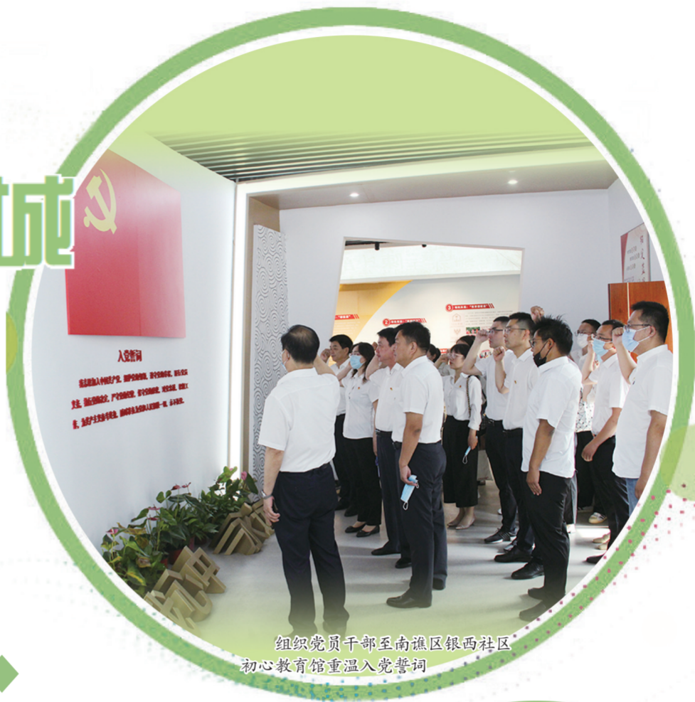
组织党员干部至南谯区银西社区初心教育馆重温入党誓词

今年以来,滁州市生态环境局在市委、市政府的坚强领导下,坚持高标准常态化推进文明创建工作,主动作为,靠前行动,建立健全长效机制,充分调动全体干部职工的积极性、主动性和创造性,将生态环境保护宣传与文明创建工作深度融合,为滁州市创建全国文明城市典范城市植入“生态”底色。