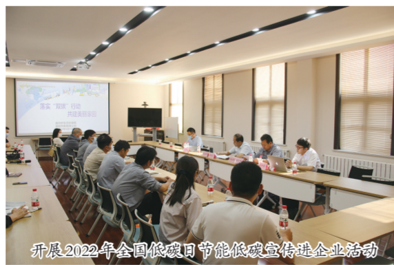
开展2022年全国低碳日节能低碳宣传进企业活动

助力改善农村人居环境。因地制宜,建管一体,加快改善农村人居环境。截至目前,已建成乡镇政府驻地污水处理设施110个,日处理能力12.4万吨,已建成各类农村污水处理设施319个,日处理能力4.2万吨。