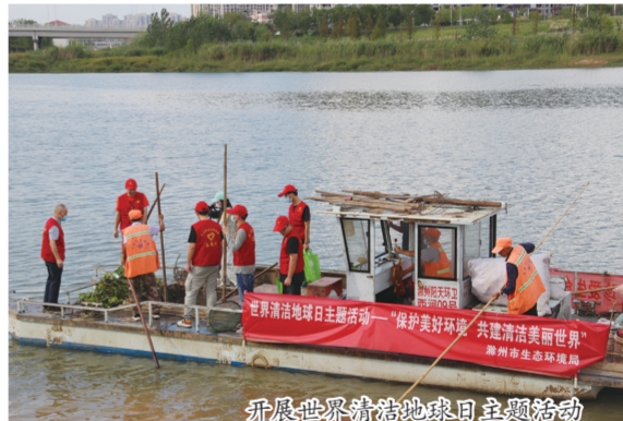
开展世界湿地日主题宣传活动

断面水质目标,以“坚守断面保碧水”专项攻坚行动为抓手,开展城市入河口排查等工作,及时交办污水外溢和城市黑臭水体等问题,高位推进河道整治相关工程进度,针对连续超标断面约谈相关县区政府,强化项目调度,推进重点项目建设。2022年1月至10月,滁州市市辖区3个断面水质优于考核目标一个类别。