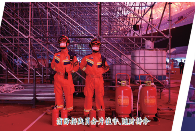
消防指战员分片值守，随时待命