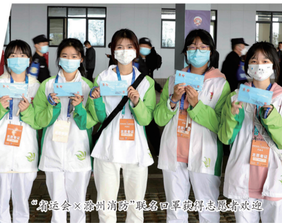
“省运会×滁州消防”联名回单获赠志愿者欢迎