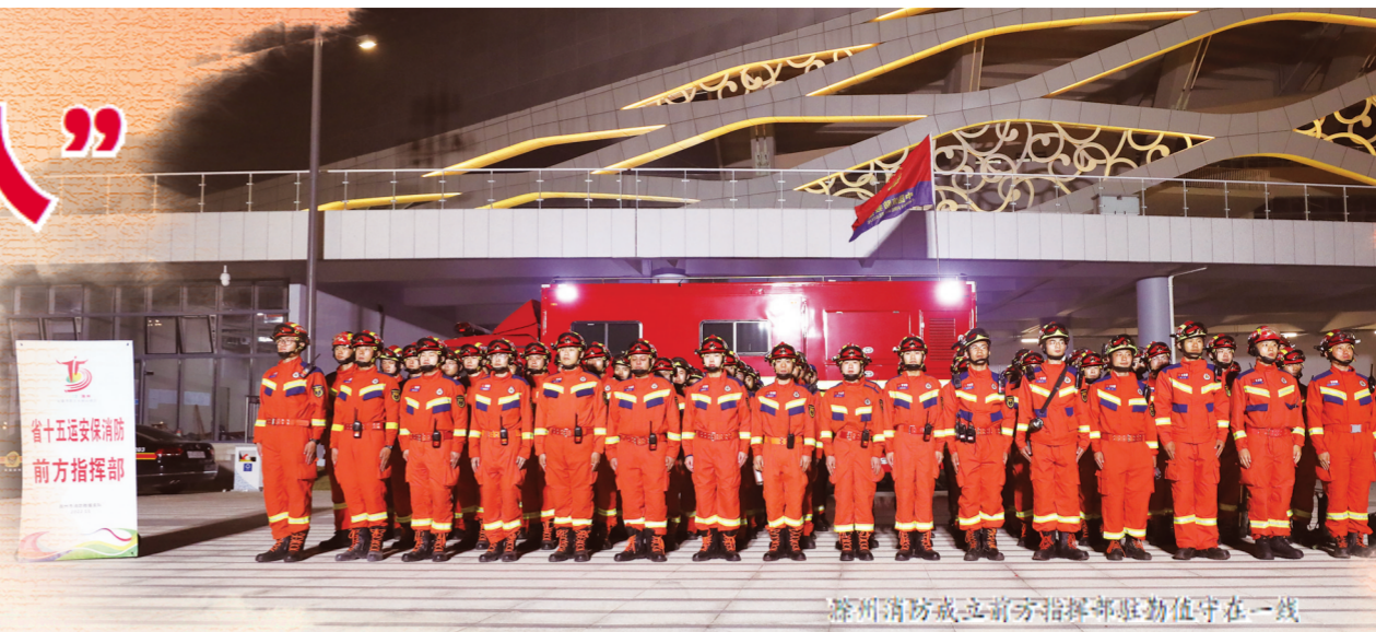
滁州消防成立前方指挥部驻勤值守在一线

赛场外，滁州市消防救援支队全体指战员战斗在不同的岗位上，他们以最昂扬的斗志、最严密的措施、最扎实的作风投入消防安保工作中，默默奉献、攻坚克难、誓夺全胜，全方位、立体化护航省运会。