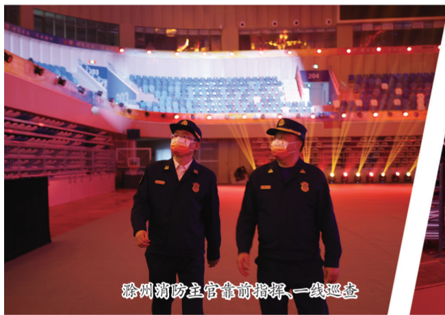
滁州消防立管会前指挥，一线巡查