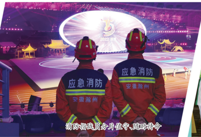
消防指战员分片值守，随时待命