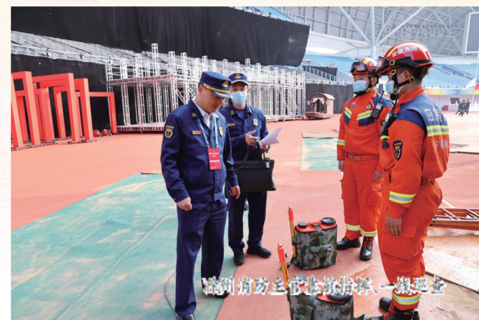
滁州消防主动靠前服务，一线安全

整个省运会期间，滁州消防全体指战员充分发挥吃苦耐劳、连续作战、敢打敢拼的优良传统，严明纪律、热情服务、文明执勤，尽职尽责，他们用坚毅和奉献守护着运动健儿“披荆斩棘”；他们用劳动和汗水换来了体育盛会的“圆满落幕”，用优良战斗作风和执法为民形象树立了一张亮丽的消防名片。