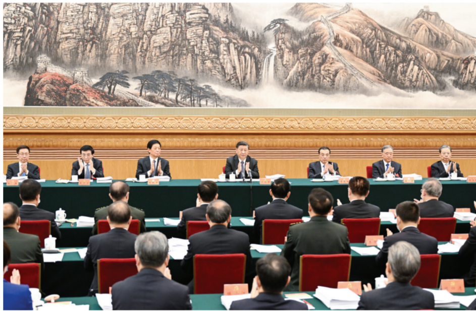
10月18日,中国共产党第二十次全国代表大会主席团在北京人民大会堂举行第二次会议。习近平、李克强、栗战书、汪洋、王沪宁、赵乐际、韩正等出席会议。