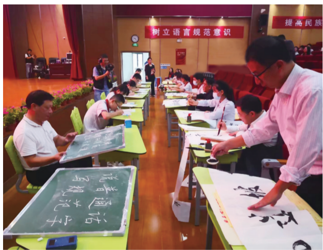
“推普周”启动仪式现场

诗意金秋,共赏中华语言文字之美。近日,我市在滁州东坡中学举办第25届全国推广普通话宣传周启动仪式,本次宣传周的主题为“推广普通话,喜迎二十大”。在仪式现场,来自该校的部分师生同场书写汉字,展示了板书、软笔、硬笔等各种书法功底,以实际行动践行“讲好普通话,写好规范字”。