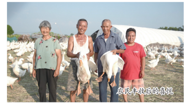
农民丰收后的喜悦

2016年4月25日，习近平总书记在小岗村主持召开农村改革座谈会时强调，解决农业农村发展面临的各种矛盾和问题，根本靠深化改革。6年来，市农业农村局牢记总书记嘱托，秉承改革基因，弘扬小岗精神，深化农村改革的脚步从未停止，改革红利不断惠及农民群众。