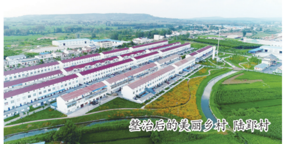
整治后的美丽乡村(陆郢村)

抓示范引领。按照“清单化管理、项目化推进、工程化建设”要求，推动省级美丽宜居自然村示范创建，今年全市36个省级美丽乡村中心村、328个重点自然村提升改造项目全面开工建设。截至目前，全市共创建省级美丽乡村示范村90个、重点示范村16个，来安县获评“中国美丽乡村建设示范县”。