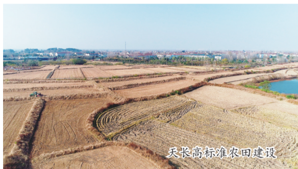
天长高标准农田建设

粮食生产根本在耕地，出路在科技。该局深入实施“藏粮于地、藏粮于技”战略，牢牢抓住耕地和种子“两个要害”，为粮食安全夯实了根基。