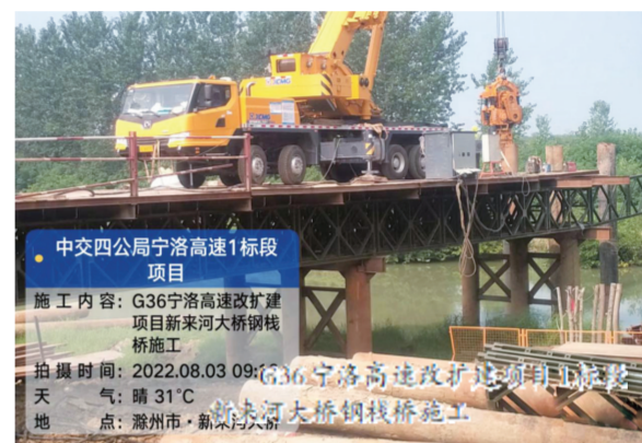
中交四公局宁洛高速1标段 项目 施工内容: G36宁洛高速改扩建 项目新架河大桥钢栈桥 桥施工 拍摄时间: 2022.08.03 09:56 天气: 晴 31°C 地点: 滁州市·新架河大桥钢栈桥施工

安全生产大于天,疫情防控重于山。面对常态化的疫情防控形势,各项目部通过在项目部以及施工现场悬挂安全条幅、发放疫情防控宣传册,大力营造浓厚的疫情防控氛围,并严格控制进出场人员流动,所有进场人员查验健康码、行程码、48小时核酸检测证明,保证进场人员信息有迹可循。