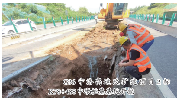
G36宁洛高速改扩建项目2标 K78+488中墩桩基悬浇

G36宁洛高速公路来安至明光段改扩建工程LJLM-3标段,全长16.768km。截至目前,该标段驻地建设、工地试验室、混凝土拌和站、钢筋加工场、预制场均已完成,沥青拌和站、水稳拌和站正在建设中。其标段范围内施工便道完成约5.4km,占比约16.1%;路基清表累计完成约20.7km,占比约61.8%;桩基累计完成58根,占比约38.2%;墩柱累计完成4根,占比约4.3%;涵洞累计完成10道,占比约4.8%;嘉山服务区西侧房建工程改造完成约60%。