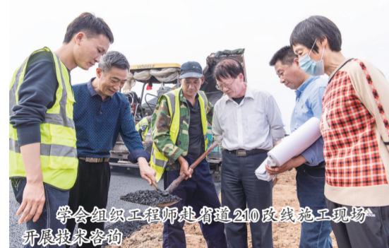
学会组织工程师赴省道210改线施工现场开展技术咨询

1982年5月，一群有理想、有追求、有情怀的公路交通科技工作者聚集在一起，怀揣着促进公路交通科技繁荣发展的初心与使命，成立了滁县地区公路工程学会（后定名为滁州市公路学会）。1982年至1987年间，成立了第一届理事会，起步阶段的学会积极组织科技人员开展技术交流活动，开展技术科研活动等。1987年至2000年，成立了第二届理事会，推进发展阶段的学会积极参加省学会组织的各种活动，多次举办各种培训班，组织工程技术人员参观学习，支持了滁全一级公路新建及合宁高速公路的建设。2000年至2012年，成立了第三届理事会，快速发展阶段的学会积极参与省公路学会组织的各项学术交流活动，成立了公路专业、汽运专业、交通管理专业3个专委会，办好《学术论文》会刊。2012年至2019年，成立了第四届理事会，改革发展阶段的学会积极开展科研活动，办好建设讲座与培训、学会会刊，积极举荐人才，开展优质工程评审等活动。2019年1月至今，成立了第五届理事会，创新发展阶段的学会加强组织建设，提升学会综合服务能力，积极搭建学术交流平台，提升学会凝聚力和影响力，树立学会品牌，服务创新驱动发展，开展科技成果推广，开展科技奖励和人才评价，开展优质工程评审、征集评选学术论文等活动。