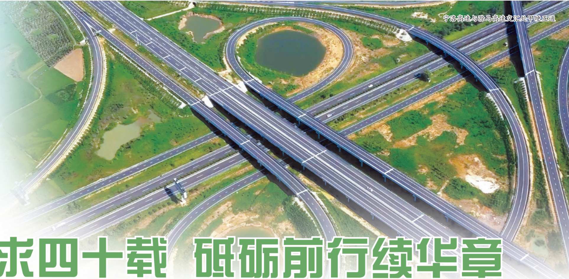
宁洛高速与滁马高速交汇处甲坝互通

40年，是一个刻度，标志着市公路学会发展的高度。 40年，是一次跨越，丈量着市公路学会发展的广度。 滁州市公路学会是由滁州市公路交通及相关科学领域的单位和科技工作者自愿结成并依法登记成立的学术性、公益性和非营利性的法人社会团体，致力于为全市交通运输事业发展服务，开展学术交流、新技术推广与应用、科学技术普及与培训、技术咨询与服务、智库培育与人才举荐、优质工程评审与职称评定等工作，是党和政府联系公路交通科技工作者的桥梁和纽带，是滁州市科学技术协会主管的全市性协会的组成部门，是全市科技创新和发展公路交通科学技术事业的一支重要社会力量。 40年来，在省公路学会、市交通运输局、市科协和市民政局的正确领导和大力支持下，市公路学会迎着改革开放的春风，伴随着交通运输事业的蓬勃发展，植根于公路交通的沃土，不断成长壮大，历经五届理事会，现有个人会员269人，团体会员单位57家，已形成了体系完整、机构健全、有较强行业影响力和凝聚力的科技社团，进一步提升了创新和服务能力，各项工作取得显著成就，重点领域实现新突破，为滁州经济高质量发展作出了积极贡献，谱写了学会创新发展的壮丽篇章。