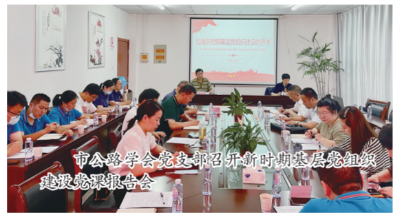
市公路学会院党委召开新时期基层组织建设工作座谈会

学会重视新技术的应用与推广，始终把公路“四新”技术的应用与推广当作一件大事来抓，组织本地企业与在滁建设的央企、名企交流，广泛推广填充式大粒径水泥稳定碎石基层材料这项“滁州技术”，把新技术的应用作为滁州市建设工程“琅琊杯”评比条件之一，鼓励自主创新，掌握核心技术，促进公路建设水平高质量发展。