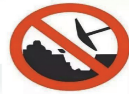
禁止开挖 下有电缆