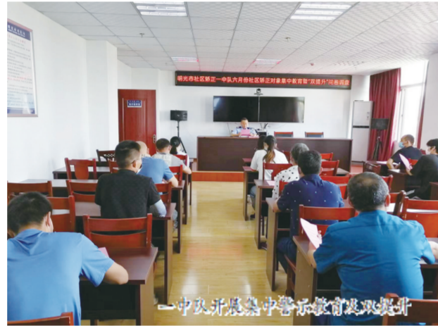
一中队开展集中警示教育提升

社区矫正“队建制”模式实施以来,明光市司法局社区矫正队伍执行力增强,硬件设施保障到位,规范化管理水平提高,矫正质量得到提升,改革取得较好成效。接下来,明光市司法局将进一步加强领导,强化管理,规范执法,高质量推进社区矫正工作依法、规范、创新发展。