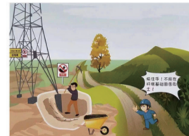
塔基附近莫取土,重心失衡易倾覆