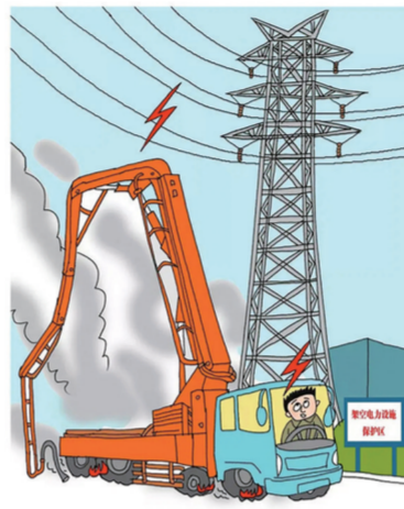
高压线附近施工,要注意安全距离!

施工中使用的吊车、泵车等大型机械都具有伸缩的功能,高压线附近施工,稍不注意就会接触到危险区域。