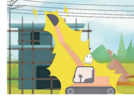
吊车施工多留意,放电危险要规避