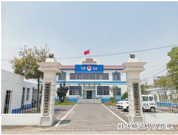
社区矫正中队外观

今年以来,明光市司法局牢牢把握矫正工作发展大局,通过夯实政策保障、整合队伍资源、激发内生动力等举措,全力打造具有明光特色的社区矫正“队建制”新模式,为建设更高水平的法治明光和平安明光贡献司法行政力量。