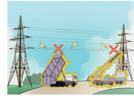
高大机械慎作业,安全距离不可越

在此,真诚提醒各位大型机械驾驶员朋友,为了您的幸福和供电安全可靠,在施工作业时,除遵守操作规程,还请特别注意: