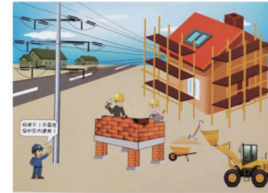
保护区内勿建房,人身安全难保障