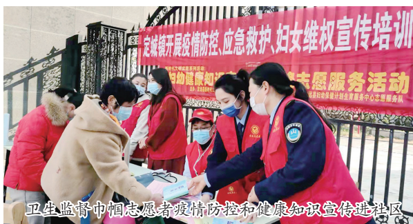
卫生监督中队志愿者疫情防控和健康知识宣传进社区

重视军民鱼水情谊。八一走访慰问武警定远中队,为驻地官兵送清凉;敬老节情系单位老党员和退伍老兵。