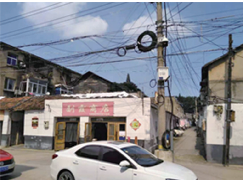
章三益南货店今貌