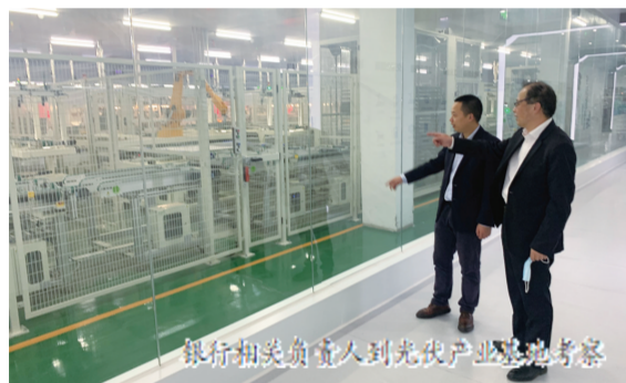
银行相关负责人到光伏产业基地考察

作为全球领先的光伏一体化产品制造商和服务商,晶科能源在滁州地区迅速投资投产,从开工到一期项目投产仅用了半年,伴随着突飞猛进的产值,公司营运资金压力也逐渐增大。了解到这一情况后,滁州兴业积极对接合作,以2亿元授信成为滁州晶科能源首家信贷合作银行。