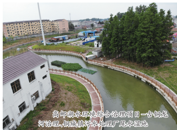
高邮湖水环境综合整治项目—古铜龙河治理、铜城污水处理厂尾水湿地

聚焦主责主业,推进人防工作。强化专业队伍建设,高标准完成年度人防专业队伍整组工作,开展“9·18”试鸣防空警报和中小学生学习疏散演练工作。推进人防项目建设,人防工程维护管理实现“三个全覆盖”。强化宣传工作,人防宣教广场已建成使用,精心筹划制作了“天长市人防宣教广场宣传片”,推送至滁州市人防办、省人防办,并且在安徽省人防抖音平台及滁州市人防办网站播放,同时通过3D数字在线系统完成人防宣教云广场建设,已正式上线。