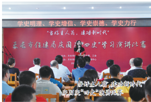
学史明理、学史增信、学史崇德、学史力行 “当好主人翁,建功新时代”

全面落实党建工作责任制。始终坚持党建工作和业务工作一起谋划、一起部署、一起推进,实现了党建工作与业务工作相互促进和共同发展。定期召开住建局系统党建工作例会,开展了党组织书记抓党建述职工作,举行党员集中培训。