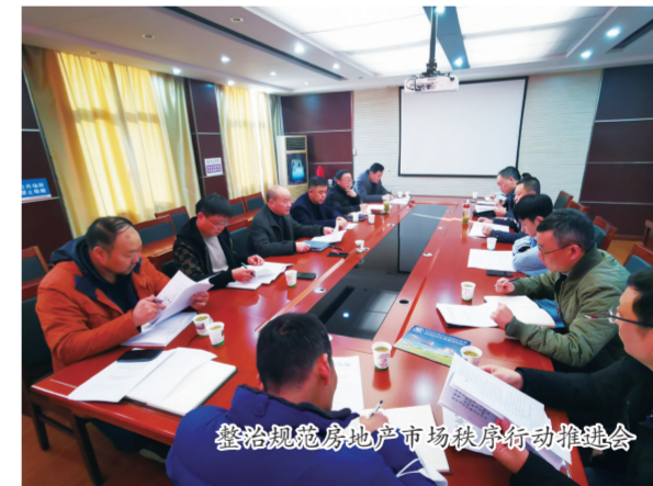
整治规范房地产市场秩序行动推进会

建筑企业不断升级。天长市住建局(人防办)不断优化产业结构,培育骨干企业,促进建筑业保持稳中有进、持续发展的良好态势。兑现奖励,根据《天长市人民政府关于推进工程建设管理改革促进建筑业持续健康发展的实施意见》要求,兑现建筑业奖励,促进建筑业健康发展,2021年对建筑业转型升级企业进行集中考评奖励,评选了资质升级奖、工程创优创奖等奖项,共发放奖励经费872.16万元。按照《滁州市建筑市场信用管理实施细则》要求,建立天长市建筑企业信用信息平台。充分发挥协会的桥梁纽带作用,加强政府和企业之间、本行业与房地产、医疗、酒店等行业之间的对接合作,促进行业共同发展。以帮扶服务为切入点,采取结对帮扶、精准帮扶,积极帮助建筑企业资质晋升,2021年受理建筑业资质初审审批72项,晋升一级施工总承包企业资质3家。2021年统计入库建筑企业87家,完成建筑业产值111.2亿元,增幅17.8%,在滁州市各县区综合得分排名第二;2021年建筑业总税收4.5亿元,同比增长26%;建筑业增加值39.4亿元,增幅4%,占GDP比重6.3%。首次跻身全省建筑业10强县(市)行列。