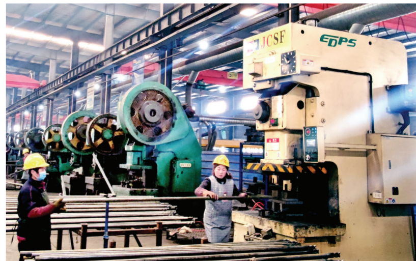
▲2月15日,位于南谯区的金诚金属有限公司,生产线上的工人们正在给金属管打磨抛光。