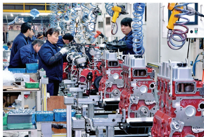
▲3月1日,全柴集团国六生产线上正在抓紧装配柴油机。该集团自节后复工以来实行24小时生产不停工,全力以赴赶订单。