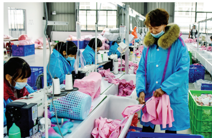
▲新春伊始,明光市景跃玩具有限公司生产车间正在加班加点生产外销玩具,力争实现首季“开门红”。