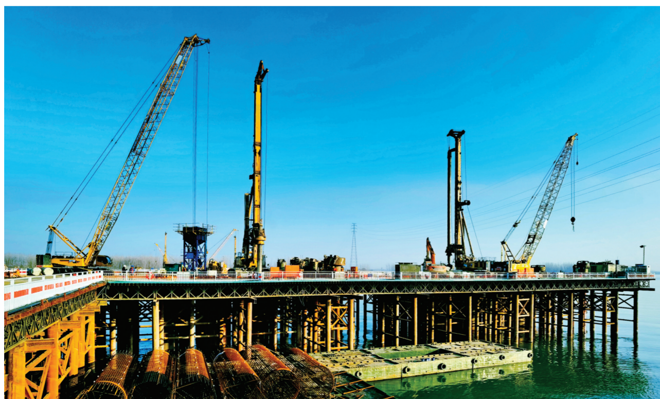
▶2月20日,凤阳至蚌埠改线工程G329临淮关跨淮河特大桥正在施工。该项目由凤阳县人民政府和五河县人民政府共同投资24亿元建设,预计工期为3年。