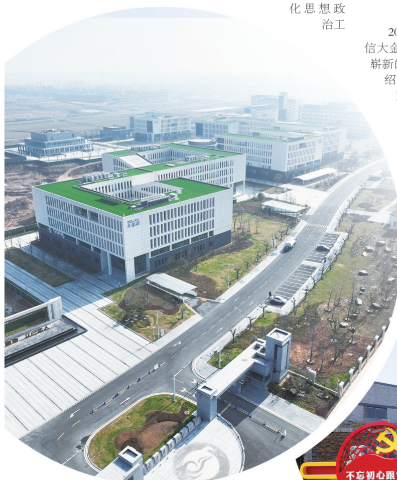
南京信息工程大学金牛湖校区

风潮正涌，自当扬帆破浪；重任在肩，更须策马加鞭。天长市冶山镇将站在新的历史坐标点上，乘势而上，凝聚和依靠全镇人民的智慧和力量，以敢为人先的魄力、敢谋大业的勇气、敢于担当的作风、奋发有为、奋勇争先、只争朝夕、不负韶华，为加快建设实力、富裕、平安、幸福、宜居冶山努力奋斗。