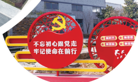
安徽省双强六好党组织-安邦电气股份有限公司党支部