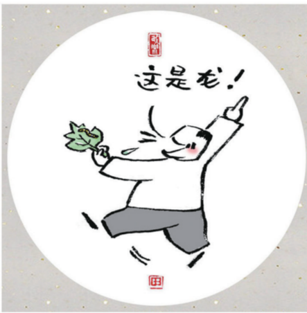
眼睛瞎不可怕 就怕睁眼说瞎话