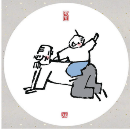
人在履行职责中得到幸福 就像一个人驮着东西可心头的很舒服