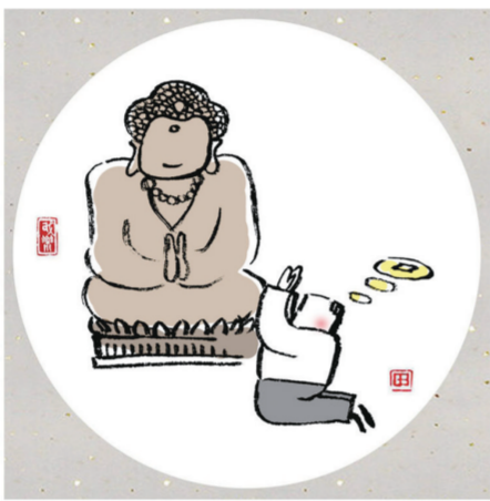
有些人拜佛 其实是在拜自己的欲望