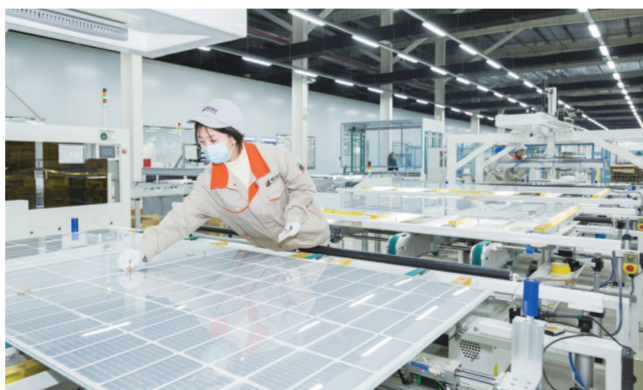
凤阳晟日能源科技有限公司生产线上,工人们正在全神贯注忙生产。

为高水平对标、高效率承接、高质量融入长三角一体化发展,我市经过考察学习、反复研究、认真谋划,于去年10月召开千人动