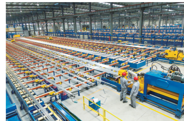
永臻科技公司的生产车间里,工人们正在忙碌。

水深鱼极乐,林茂鸟知归。“营商环境建设没有‘休止符’,只有‘渐强音’。”市“四最”办负责人表示,未来将聚焦企业和客商最迫切的需求,多点发力,多方合力,全力破除瓶颈制约,激发市场主体活力,推进滁州优化营商环境向着更深更广的领域挺进。