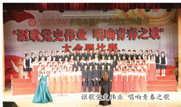
讴歌党史伟业 唱响青春之歌

今年是中国共产党成立100周年,“十四五”开局之年,学校积极强化党建引领,深入贯彻党的十九大和十九届二中、三中、四中、五中全会精神,紧紧围绕落实立德树人根本任务,以党的政治建设为统领,扎实推进党的各方面建设,全面提高学校党的建设质量和水平,为办好人民满意教育提供坚强保证,确保“十四五”开好局、起好步。