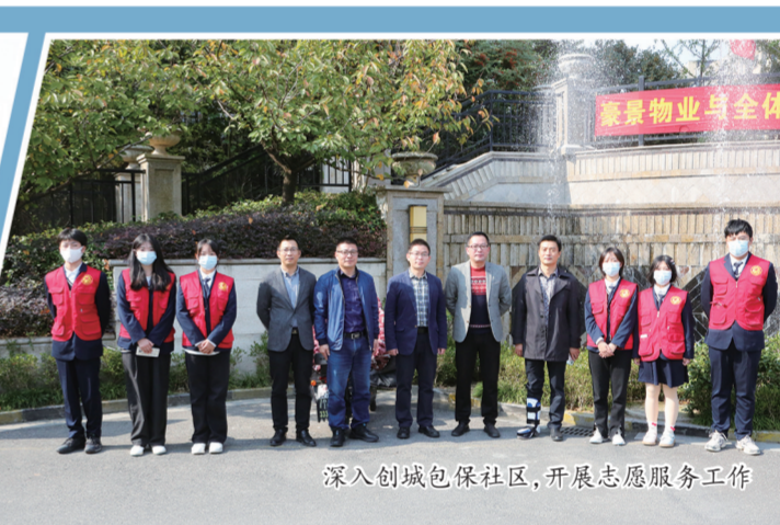
深入创城包保社区,开展志愿服务工作