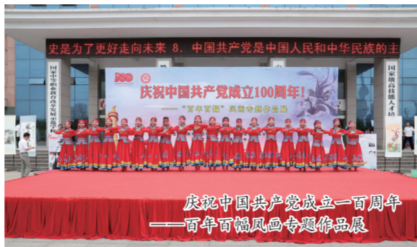
庆祝中国共产党成立一百周年——百年百幅凤画专题作品展

学校充分挖掘中华优秀传统文化的传承优势,坚持“内涵、特色、创新、开放、多元”的宗旨,利用现有资源,以滁州地方非遗——“凤阳花鼓、凤画”为突破口,以志愿文化、体育文化等特色文化教育为抓手,致力于做好学校艺术文化特色教育品牌工作,从实际出发,树立文化治校、特色引领,丰富校园文化生活。