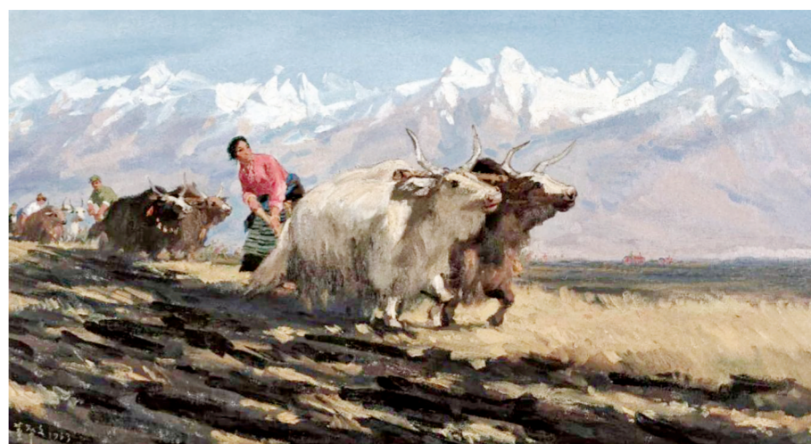
《千年土地翻了身》(油画) 董希文