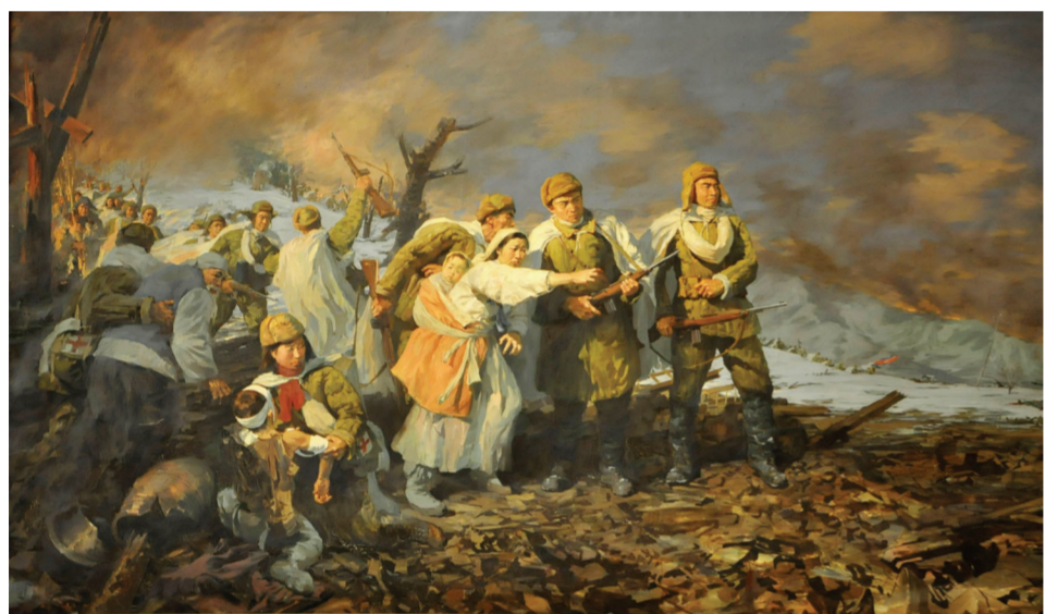
《抗美援朝》(油画) 董希文