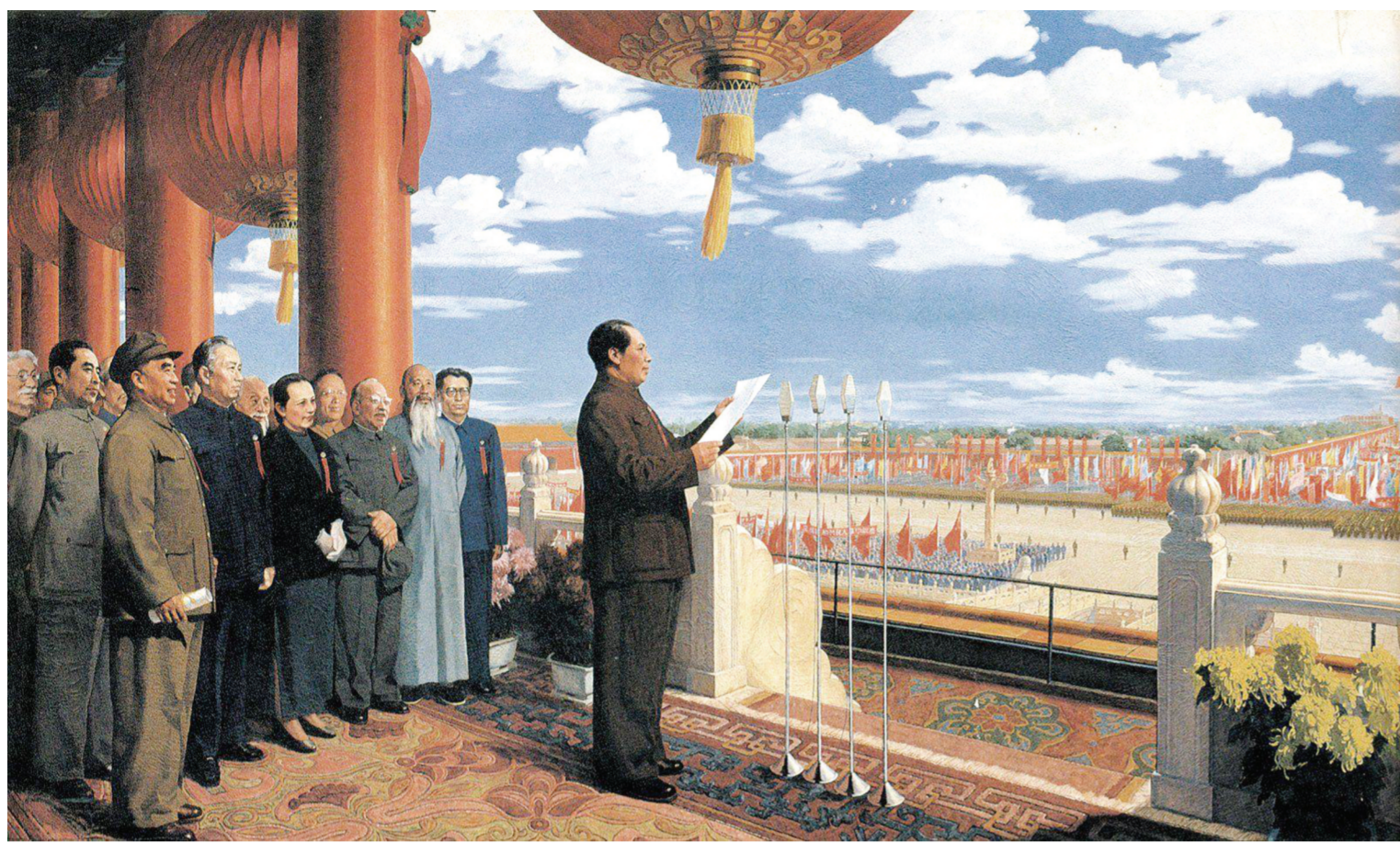
《开国大典》(油画) 董希文