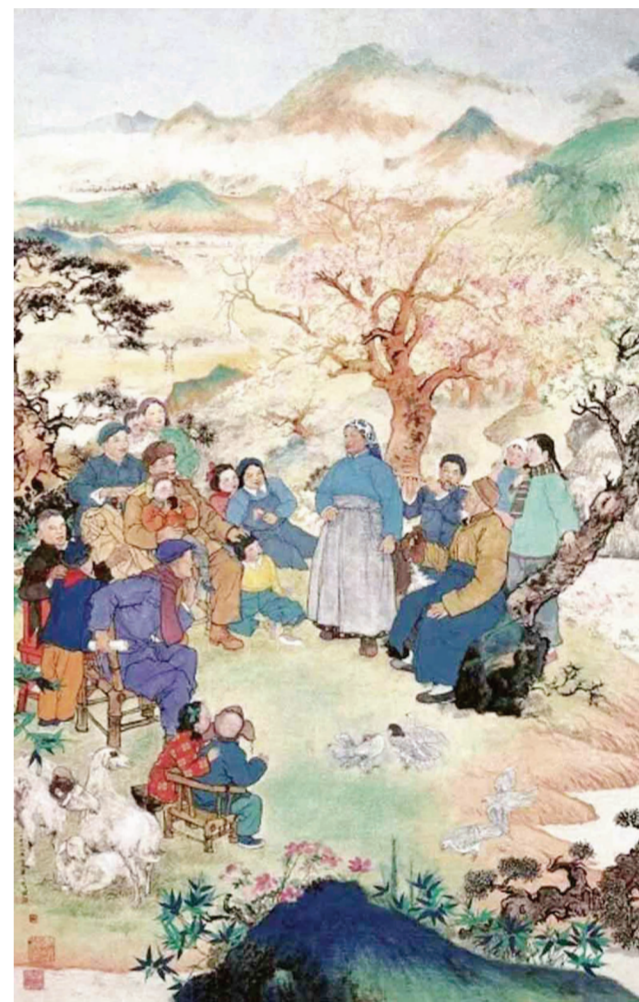
《歌唱祖国的春天》(国画) 程十发