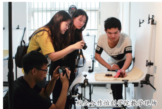
校企合作创客学院教学现场

产教融合取得新拓展。深化教育链与产业链有机融合，搭建“产教融合”平台。牵头组建“安徽滁州职教集团”，吸纳成员140家，设立15个专业工作委员会。2019年职教集团获首批“省级示范职教集团”建设单位，并入围第一批全国示范性职业教育集团（联盟）培育单位。学院先后与157家企业签订合作协议共同进行人才培养、共建实训基地，并被遴选为安徽省首批校企合作示范典型学校。