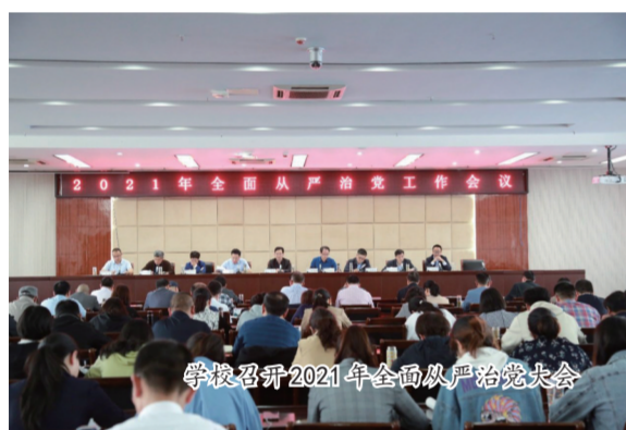
学校召开2021年全面从严治党大会

滁州职业技术学院始终把党的政治建设放在首位，过去五年，学院始终坚持用党的旗帜引领办学方向、指导教育教学实践、凝聚改革发展力量，不断推动学院达到新的发展高度。