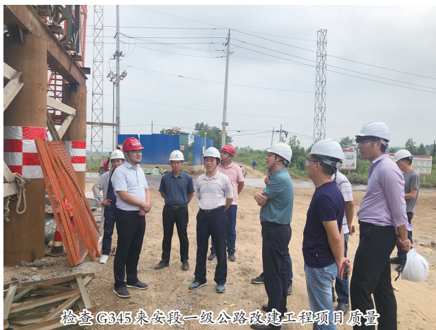
检查G345来安段一级公路改建工程项目质量