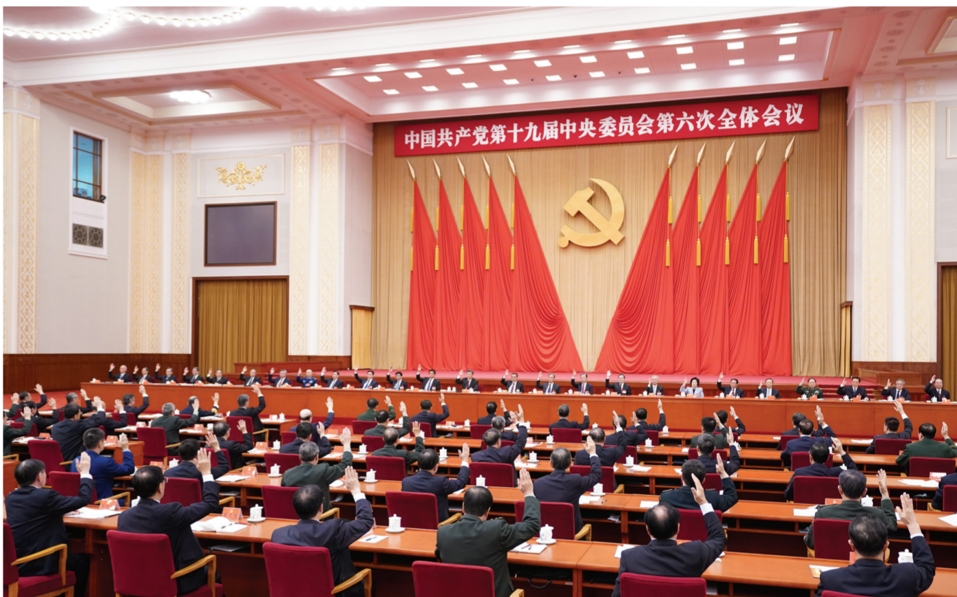
中国共产党第十九届中央委员会第六次全体会议,于2021年11月8日至11日在北京举行。中央政治局主持会议。