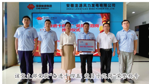
该党支部荣获“奋进十四五 党员示范岗”荣誉称号

“刘书记，我申请取消我本次的休假，在这次大部件维修任务中留下来，一来本次维修需要大量人手，二来我想以此为契机在您后面好好学习……”这是来安风电场支部党员与支部书记之间的一段真诚对话。风电运检一线是最丰富的“实战”岗，该党支部通过“以老带新”“技术培训”“模拟竞赛”等多种形式，让年轻同志在一线岗位实践中淬炼成才，坚定信念、任事担当，把为党工作作为第一职责。