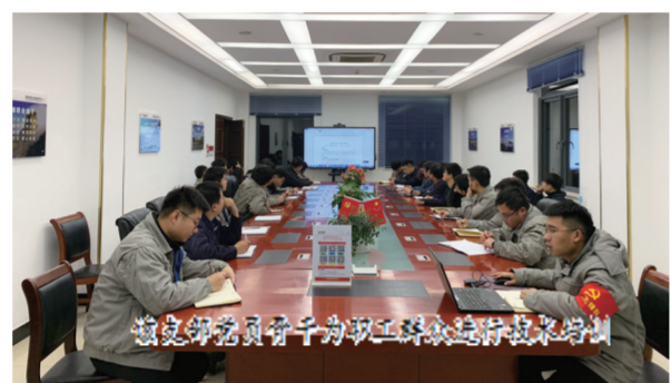
该支部党员于年初二开展线上技术培训

“延安时期，陈云由于家境贫寒，只读过小学，但能够成为党和国家的卓越领导人，与陈云终身重视学习，严谨治学密不可分……”这是该支部党员在为职工群众讲党课。自党史学习教育开展以来，来安风电场党支部创新学习教育载体，让党史学习教育走进班组一线，以“党员讲给职工听”的授课形式，利用班前会、班后会、晚自习等时间，让职工群众学习“不掉队”。