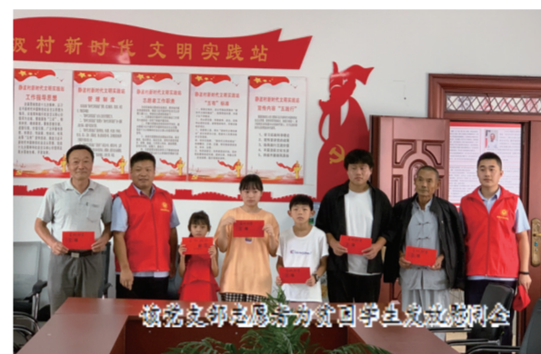
该支部党员于开学前夕召开谈心会

开学前夕，来安党支部主动联系杨郢乡静波村开展金秋助学活动，志愿者与贫困学子召开“谈心会”，详细了解贫困学生的学习、生活情况，并为8名学生发放了助学金，并结合自身经历，分享职业生涯中的小故事，勉励学子要正视困难，磨炼意志，树立信心，用知识改变自己家庭的命运，用优异的成绩回报社会。