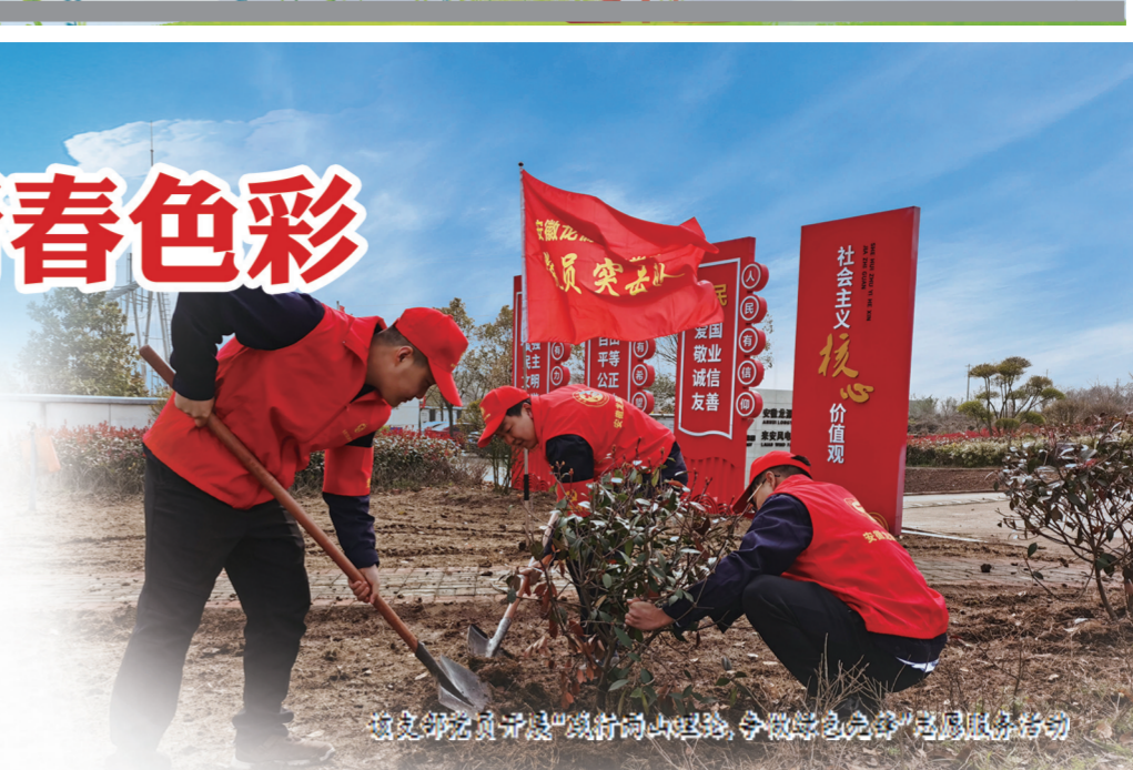
该支部党员于清明节前夕，开展“绿色先锋”志愿服务活动

“在学思践悟中坚定理想信念，在奋发有为中践行初心使命！”习近平总书记给复旦大学党员志愿服务队全体队员的回信中的寄语，激励着广大青年党员用实际行动践行自己的青春力量。在安徽龙源风力发电有限公司来安风电场，有这样一支平均年龄27周岁的年轻党员团队，他们有态度、有行动、有温暖，一名党员就是一面旗帜，飘扬在“风电安全稳定运行”一线，飘扬在“我为群众办实事”志愿服务一线。今年以来，该党支部先后荣获滁州市“最佳志愿服务组织”、国家能源集团“奋进十四五 党员示范岗”荣誉称号。