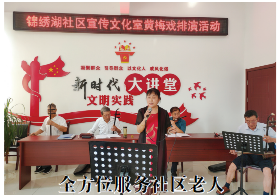
全方位服务社区老人

9月11日,市、区共同举办的“2021年全国科普日”滁州市主场活动在科技馆启动。活动专题展示了科学家精神和青少年机器人项目、无人机、3D打印笔等企业科技成果。