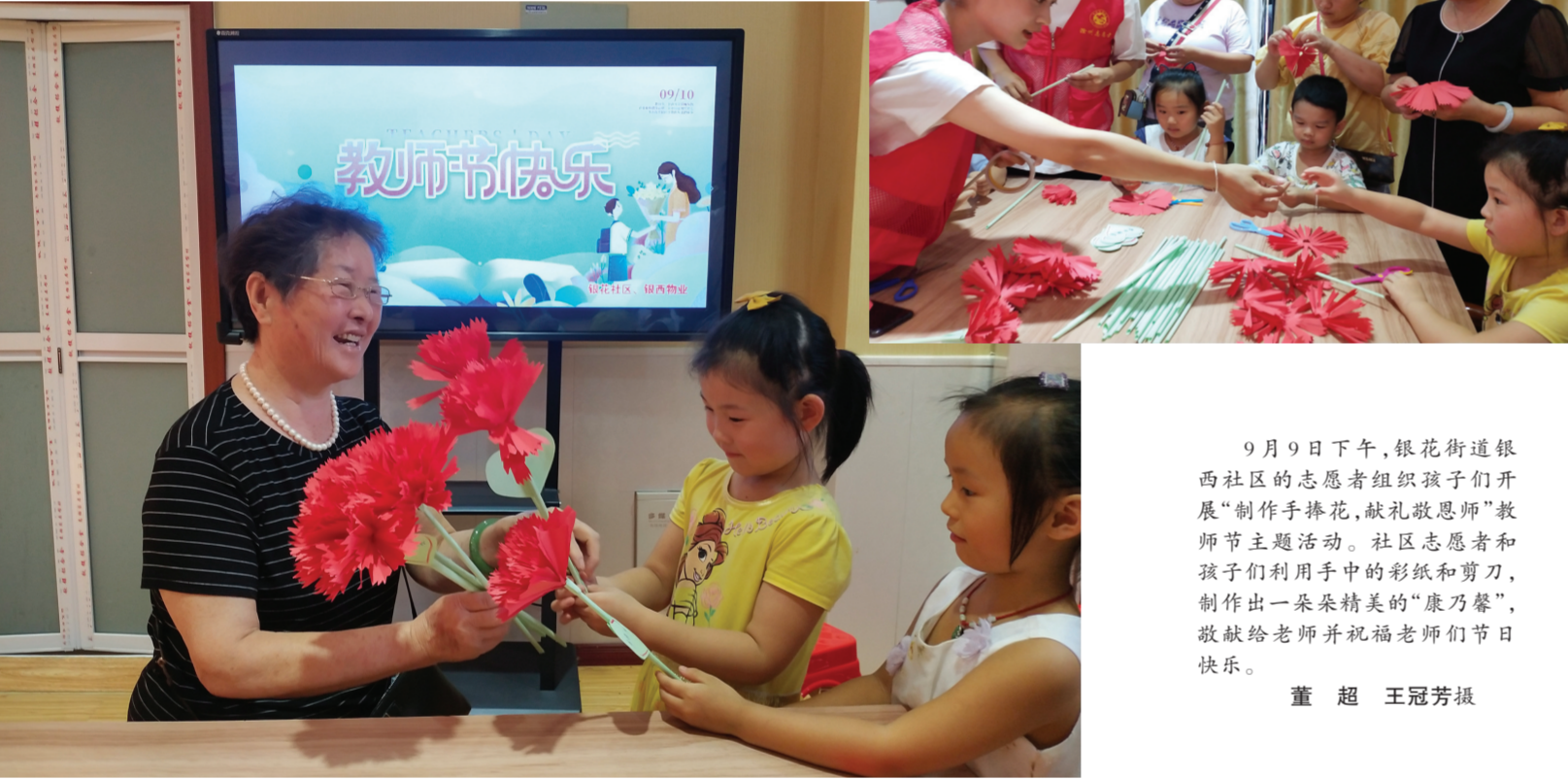
9月9日下午,银花街道银西社区的志愿者组织孩子们开展“制作手捧花,献礼敬恩师”教师节主题活动。