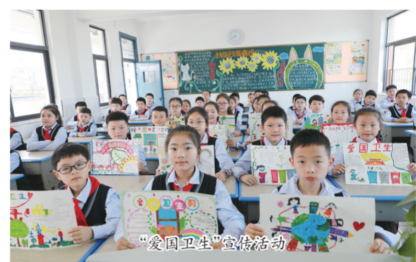
“爱国卫生”宣传活动

局机关各股室、各中小学校和把创建工作与股室业务、学校工作充分融合,以创建促进股室和学校工作全面提升,水涨船高,不断完善创建常态长效机制,持续巩固提升文明创建成果。