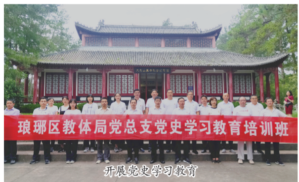
开展党史学习教育

深耕党史,培植红色基因。全面落实立德树人根本任务,将青少年学党史和未成年思想道德建设融合推进。以“从小学党史 做好接班人”为主题,各中小学校和幼儿园开展形式多样的青少年党史学习教育。通过上好党史思政课、“四史”宣讲进校园、组织“红歌大家唱”、读红色著作、寻红色足迹、访红色老兵、办“青春心向党”主题班会、送“青春心向党”微视频等“九个一”系列活动,教育学生读懂百年党史,汲取红色伟力,为实现