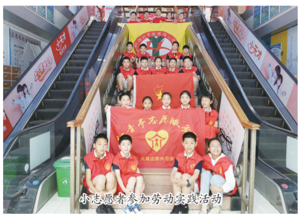
小志愿者参加劳动实践活动

国以才立,政以才治,业以才兴。素质教育是培育人才的良策,是时代发展的呼唤,也是学校文明创建的核心。近年,琅琊区教体局锚定素质教育这一重点目标任务,奋力推进教体事业高质量发展。