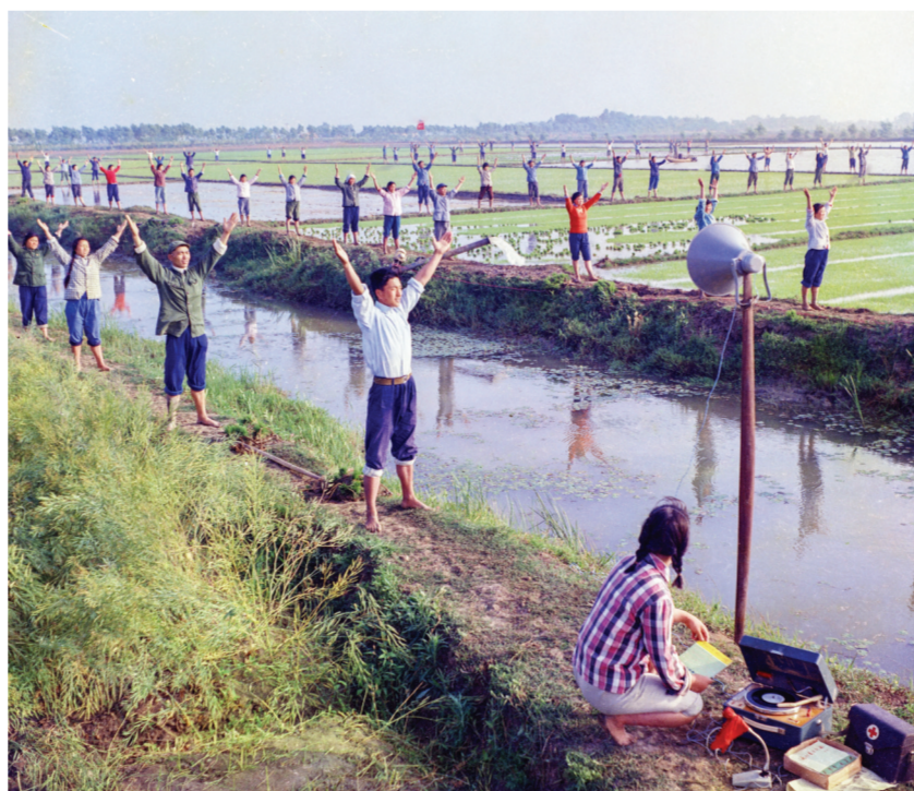
▲全椒县官渡公社在大力发展农业生产的同时，积极开展农村业余体育活动，增强群众体质，成为全省农村体育运动的先进单位。此照片《田间广播操》1975年入选全国体育摄影比赛并获优秀奖，次年《中国摄影》杂志发表改为《园田新风》。 1975年摄