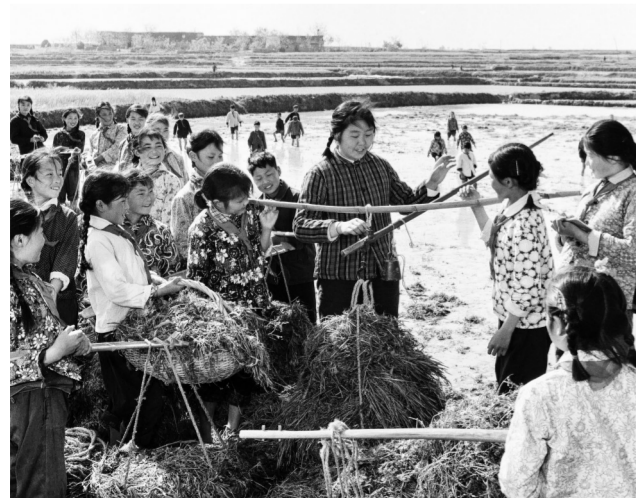
▼滁县乌衣公社白庙小学学生利用课余时间打秧草，交给生产队做秧田绿肥。（此片入选1977年全国影展，同年《中国摄影》第5期发表） 1976年摄