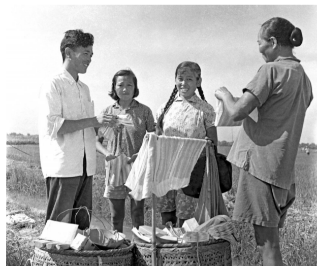
▲来安县汉河供销社的营业员挑货郎担走乡串村，送货到农村，深受群众欢迎。 1965年摄