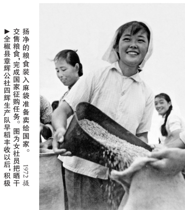
▲全椒县章辉公社四牌生产队早稻丰收以后，积极扬净的粮食装入麻袋准备卖给国家。 1972年摄