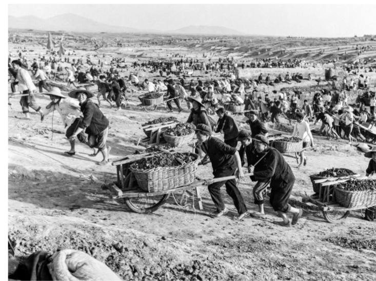
▲驷马山引江灌溉工程，是我省大型水利排灌工程，北至全椒襄河口，南至长江，穿越和县和乌江镇。1969年-1971年出工总人数达20万，全椒干群还自发组织“突击队”“爆破队”，涌现出许多治水英雄和劳动模范。 1969年摄