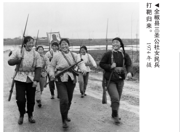
▲全椒县三圣公社女民兵打靶归来。 1974年摄