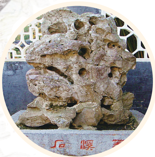
醉翁亭景区内复溪石