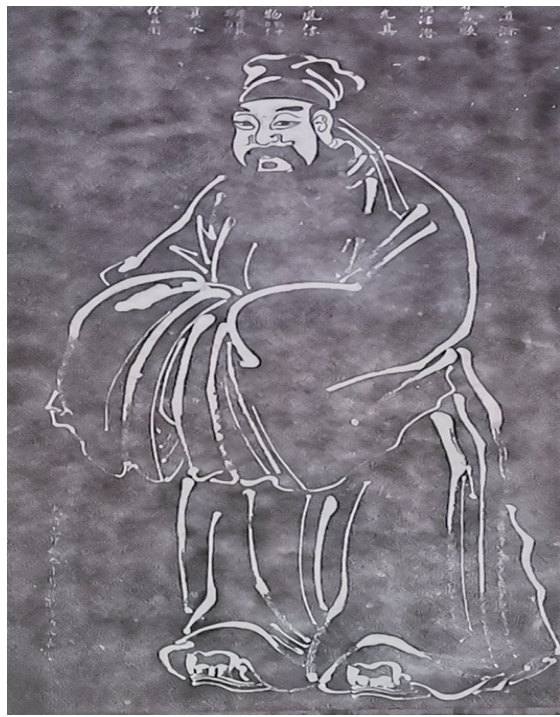
扬州平山堂欧阳修石刻小像