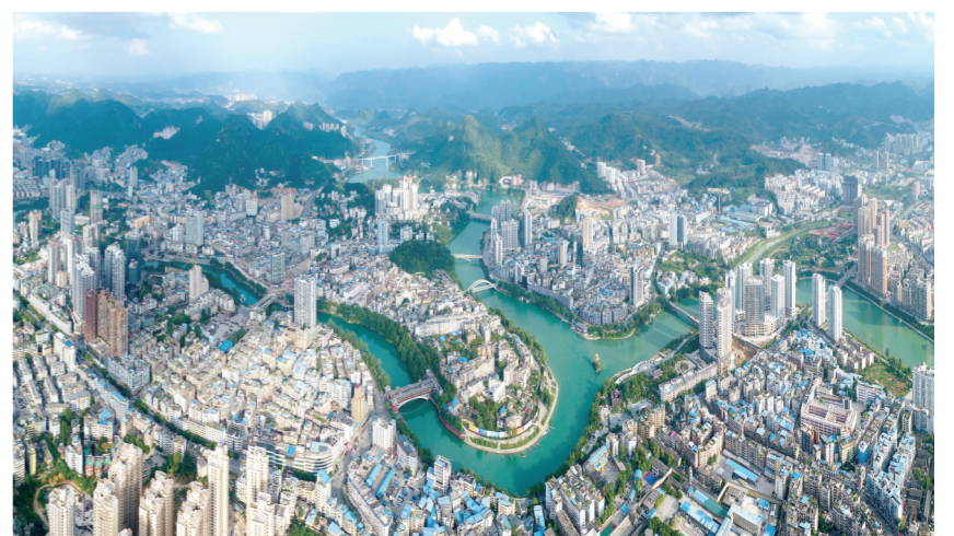
大美铜仁。