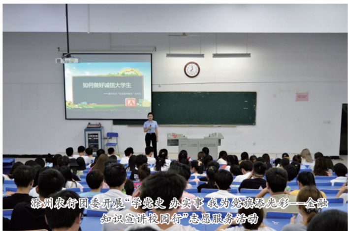
滁州农行团委开展“学党史 办实事 我为群众办实事”金融知识宣讲团“志愿服务活动

传承“红色基因”。追寻“小岗精神”,拍摄党史学习教育宣传视频,讲述小岗拉开改革开放序幕的故事,回顾农行服务小岗的历史沿革,传承红色历史、继承红色文化,坚定服务地方发展的信心决心,提升社会形象与服务水准。召开“学党史 践初心 争当青年先锋”暨“五四”青年员工座谈会,听取青年员工代表心得交流,表彰优秀青年员工,“并从工作中显身手展才华、到一线建新功立新业、主动做表率当示范”等方面对青年员工提出具体要求。