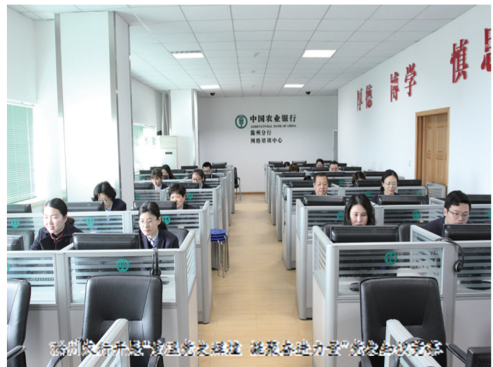
滁州农行开展党史知识讲座 凝聚各地方“学党史”合力

“走出去”。组织科级干部、党支部书记赴天津培训学院参加学习贯彻十九届五中全会精神暨基层党支部书记党史学习教育培训班,安排中国共产党党史专题课程以及红色教育基地现场教学。辖内各支行分赴抗大八分校、藕塘烈士陵园等当地红色教育基地开展党史学习教育,追寻红色足迹,缅怀革命先烈,传承革命精神,重温入党誓词,让红色历史深植广大党员干部心中,推动党史学习教育走深走实。