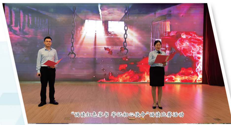
“诵读红色家书 牢记初心使命”诵读比赛活动