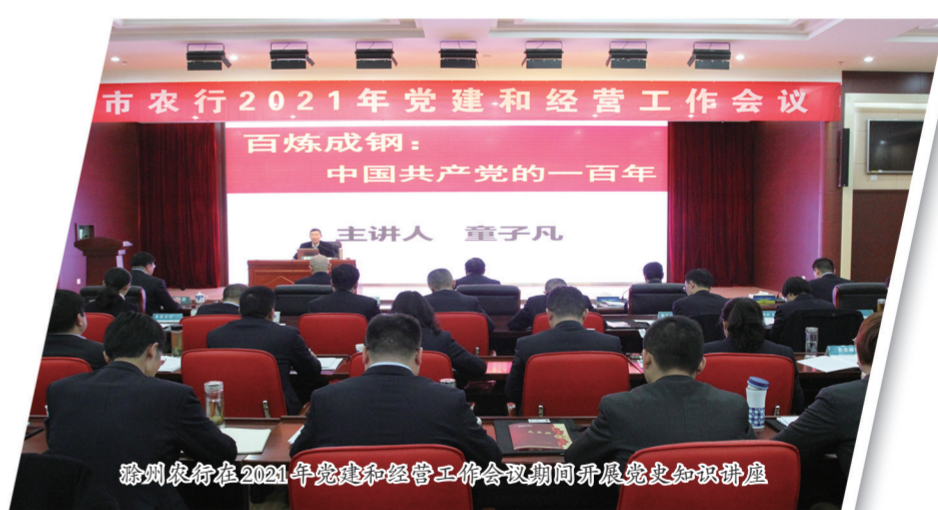
滁州农行在2021年党建和经营工作会议期间开展党史知识讲座