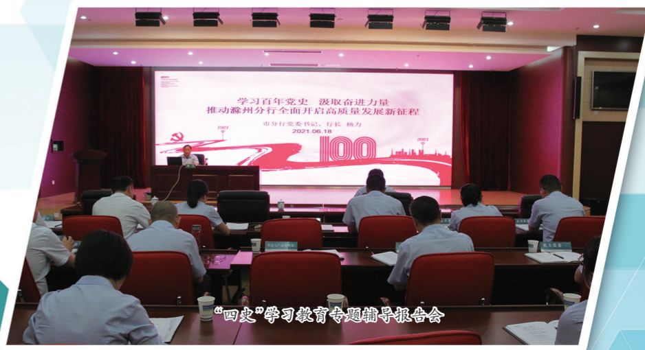
“四史”学习教育专题辅导报告会