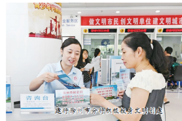
建行滁州市分行积极参与文明创建

百年征程波澜壮阔,百年初心历久弥坚。在今后的工作中,建设银行滁州市分行全体党员干部必将继承先烈遗志,传承革命精神,不忘初心、牢记使命,忠诚担当、奋勇前行,以更加昂扬的姿态和更加饱满的工作激情,以优异的工作业绩庆祝建党100周年。