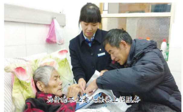
为老年客户提供贴心上门服务

关爱老年客户,多渠道、全方位持续提升“适老”金融服务水平。员工更热心,充分利用晨会、夕会、培训等进行宣讲教育,引导和强化网点员工树立“爱老、敬老”的服务观念,为老年客户提供有温度的金融服务。设施更贴心,对无障碍设施升级改造,为老年客户设立爱心窗口,设置爱心座椅,配备老花镜、医药箱、轮椅、验钞机、雨伞等,营造温馨舒适的服务环境。操作更省心,扎实推进智能服务适老化改造,在智能设备上设置语音指引、调高音量,切实解决老年客户使用智能设备困难。针对老年人习惯使用存折办理业务的特点,优化网点智慧柜员机存取款功能,有效提升老年客户业务办理效率。服务更暖心,持续深化“劳动者港湾”建设,做好便民设施更新维护,为前来办理业务的老年客户提供热水、如厕、充电、阅读等服务,主动为行动不便、身体不适等无法现场办理业务的老年客户提供上门服务。