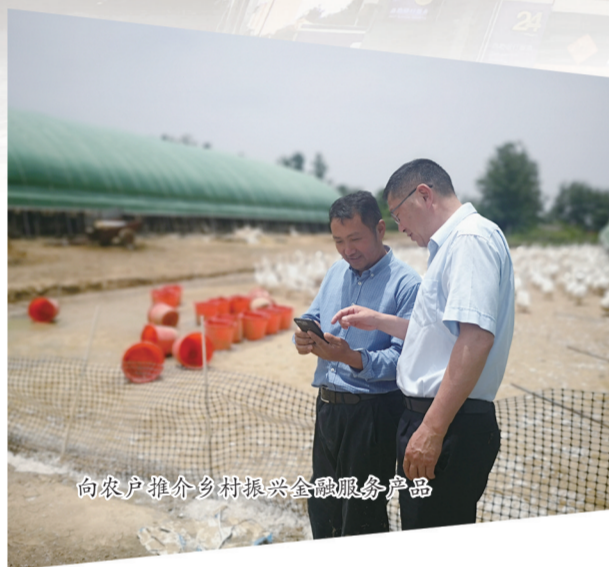
向农户推介乡村振兴金融服务产品

岁月鎏金,党旗飘扬。一艘小小红船承载着人民的重托、民族的希望,越过急流险滩,穿过惊涛骇浪,百年征程,如今已成为领航中国行稳致远的巍巍巨轮……今年以来,建设银行滁州市分行始终坚持“以人民为中心”思想,通过开展“我为群众办实事”实践活动,把学习党史同总结经验、观照现实、推动工作结合起来,并依据行业特点和自身实际,用心用情用力纾解社会痛点难点,解决社会的困难事、群众的烦心事,切实服务实体经济发展和民生改善,增强人民群众的安全感、获得感、幸福感。