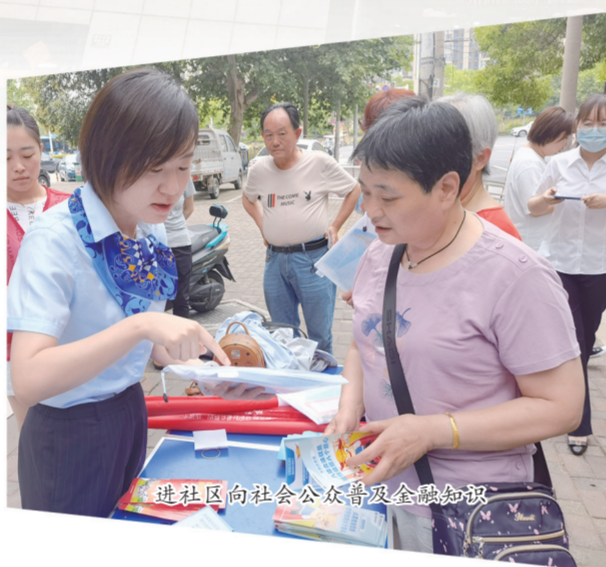
进社区向公众普及金融知识