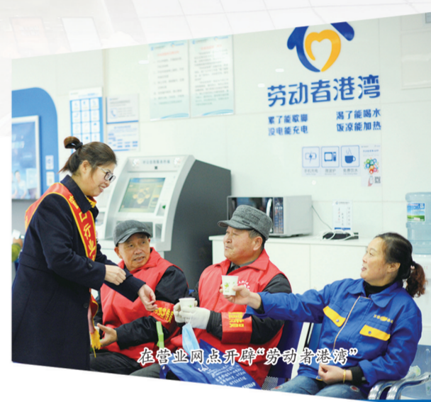
在营业网点开辟“劳动者港湾”