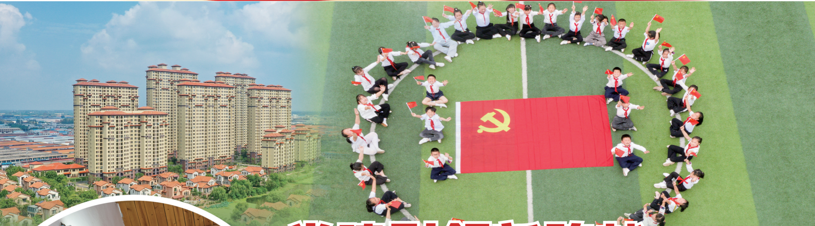
“童心向党 欢庆六一”