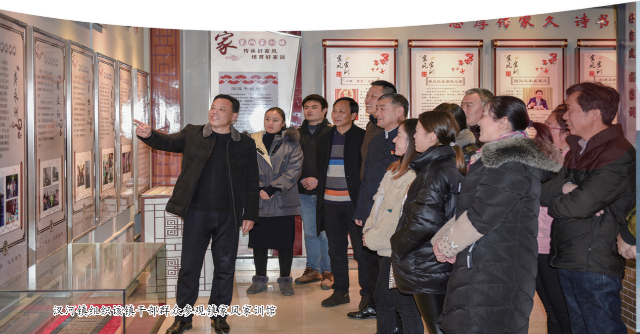
汉河镇组织镇村干部群众参观镇家风家训馆