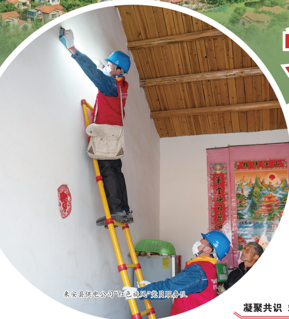
来安县供电公司“红色旋风”党员服务队

百年征程,薪火相传。近年来,该县各级党组织和广大党员干部在县委的坚强领导下,以党的政治建设为统领,坚持党要管党、全面从严治党,扎实开展“不忘初心、牢记使命”主题教育,着力加强政治思想建设、干部队伍建设、基层党组织建设和党风廉政建设,为推动全县各项事业发展提供了坚强的政治保障。