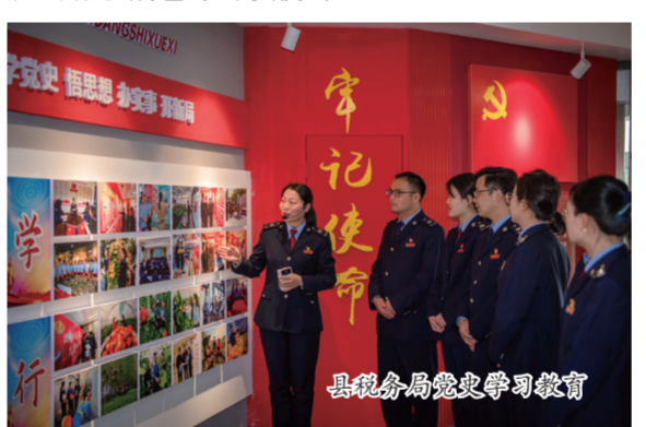
县税务局党史学习教育

心中有信仰,脚下有力量。近年来,来安县坚持以党建为引领,积极创新基层治理体制机制,真正把党的政治优势、组织优势、群众工作优势转化为基层治理优势,形成了一套独具特色的“来安模式”。