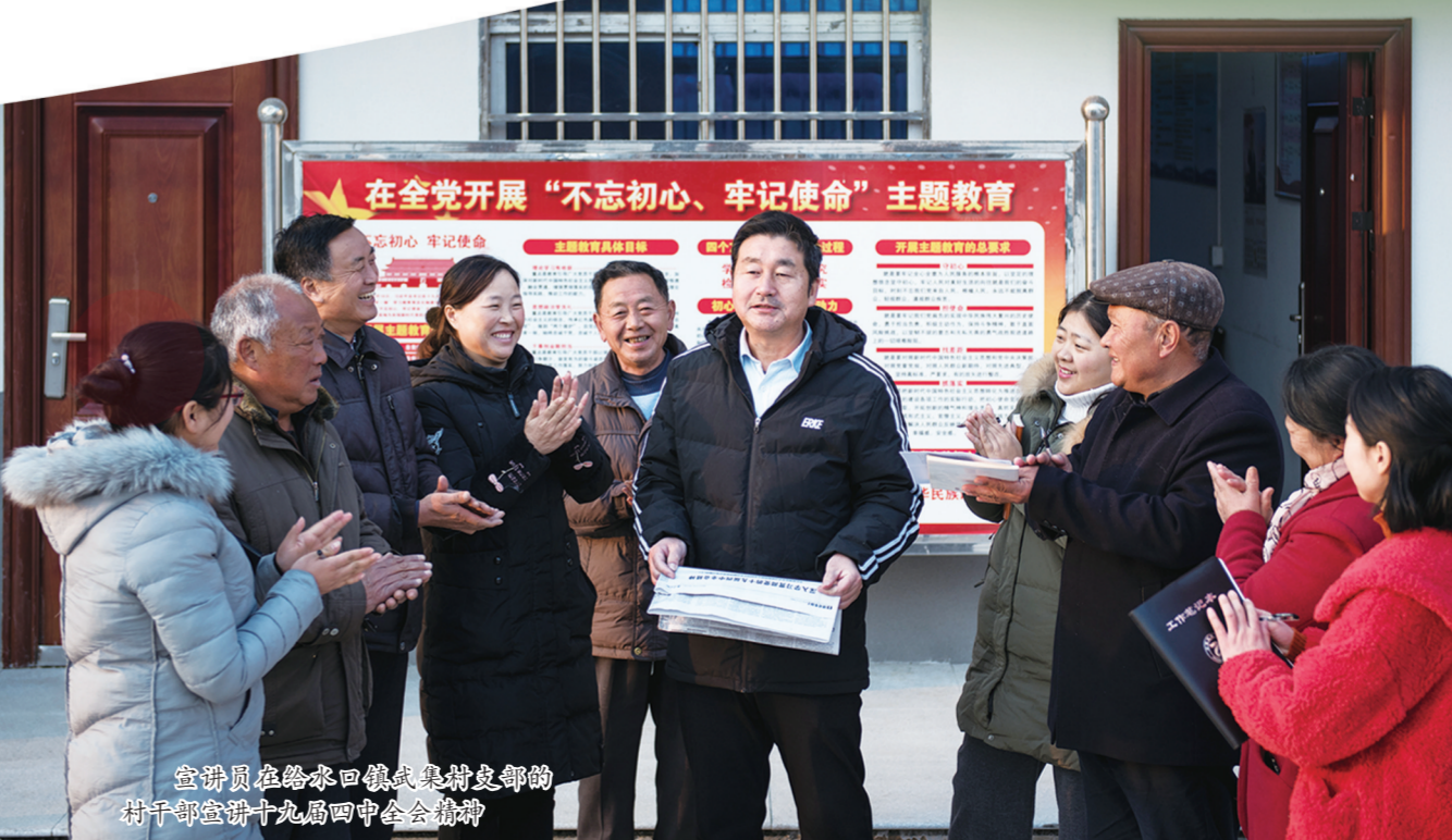
宣讲员在禄永口镇武集村支部的村干部宣讲十九届四中全会精神