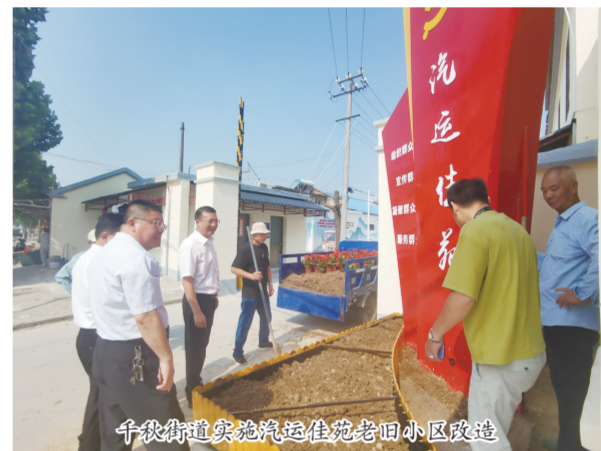
千秋街道实施汽运佳苑老旧小区改造

项目、认领困难群众与留守儿童“微心愿”,走访慰问困难家庭、辖区环境卫生整治、解决辖区物业与业主矛盾等各类活动。同时,结合“四送一服”和“万企千助”行动,街道党政班子领导深入群众当中和企业一线,深入排查梳理并解决群众急难愁盼问题;坚持群众路线,在服务群众时充分发挥党员先锋模范作用,把学习与改进作风、提升形象结合起来,通过为民服务的生动实践不断提升工作服务的能力和水平。