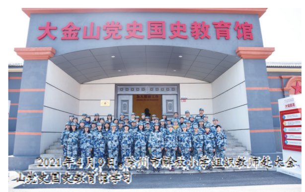
2021年4月9日,滁州市解放小学组织教师赴大金山红色教育基地研学

“国无防不立,民无兵不安”,国泰才能民安。在中国共产党成立100周年之际,解放小学继续以国防教育为抓手,以无畏的勇气开拓前进,以无限的忠诚执着追求,在琅琊山脚播下爱国与文明的种子。众力所举,献礼百年!