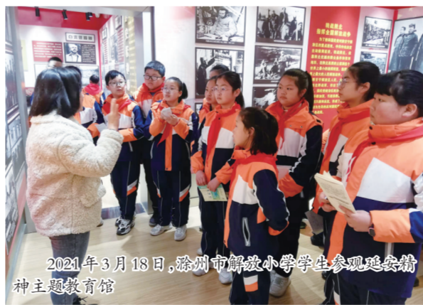
2021年3月18日,滁州市解放小学学生参观红色精神主题教育馆

4月9-10日,学校48个教学班,每个班级选派一名班主任或辅导员,前往江苏溧水大金山国防园,参加为期两天的素质拓展训练活动。赋师能,让国防教育特色教育能力成为了解放小学师资潜在的底蕴。