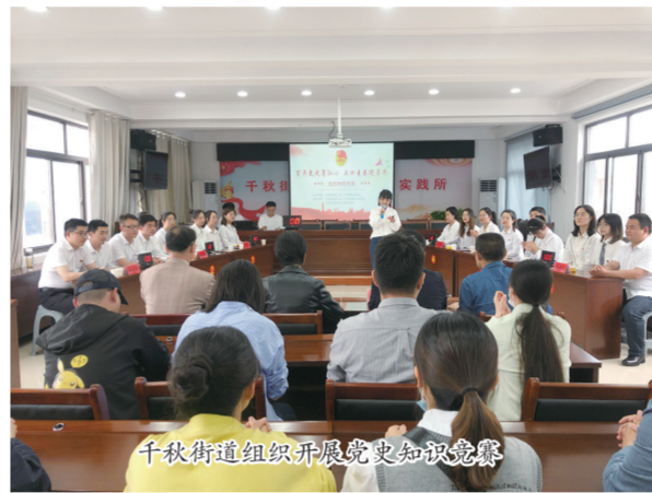
千秋街道组织开展党史知识竞赛

按照党史学习教育实施方案要求,街道还组织开展各类党史学习教育主题活动:清明节组织党员前往烈士陵园开展祭奠英烈活动,缅怀革命英雄;组织党员开展“诵红色经典、铸千秋伟业”朗诵,开展党史演讲、党史知识竞赛、“学党史、唱红歌、颂党恩”等活动;机关和社区开展“我与党旗合个影”活动,为党的生日送上一份祝福;利用“六一”儿童节等节日开展“童心向党”相关活动,推动红色基因代代传承;组织党员参加上级组织的“举旗帜、送理论”“现阶段再出发”等党史专题宣讲;在“七一”前夕,街道机关和各