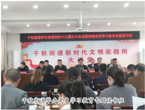
千秋街道新时代文明实践所开展党史学习教育专题读书会

线下采取集体学习和个人自学的方式,利用“三会一课”带领党员学习“四个专题”的党史,做好学习笔记;邀请