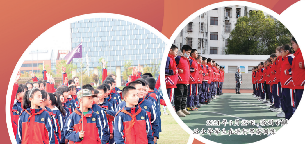
2021年3月23日,滁州市解放小学学生在进行军事训练

琅琊胜境,玉带南湖,碧水之央,有一和雅圆融的教育之方——滁州市解放小学。她是一方具有悠久历史和深厚文化底蕴的菁菁校园。“和雅解放”正以建党100周年为契机,突破教育内卷,把“五育并举”融合于“国防教育”这一特色之中,“和”中创新,“雅”中求健,崇德尚健,立志报国。外练康健之体,内修报国之魂。逐步形成校园文化建设一品特色——“和雅解放,五润国防”。