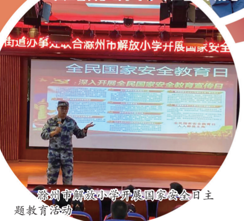
滁州市解放小学开展国家安全主题教育活动