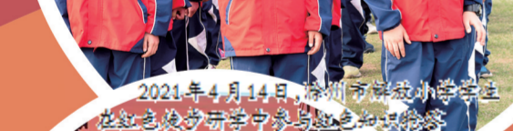
2021年4月14日,滁州市解放小学学生在红色校史馆研学中参与红色知识问答