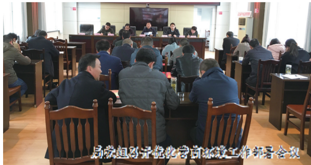
局党组理论学习中心组理论学习工作会议

瞄准县委县政府打造“亭满意·定放心”优化营商环境目标任务,县局党组一班人定期专题研究部署,把优化营商环境作为一把手工作来抓,成立工作专班,对全面深化商事制度改革作出周密安排。依托“互联网+政务服务”提速扩面,通过深化“多证合一”“证照分离”“全程电子化”“简易注销”等简政放权举措,加大企业开办“六个一”体系建设工作力度,企业开办按下“快进键”,市场准入门槛和成本不断降低,市场活力得到进一步激发。