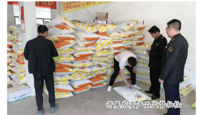
开展农资产品监督抽检

度,为地方经济发展提供技术支撑。持续深化“满意消费长三角·放心消费定放心”行动,培育县级“放心消费”经营户83家,市级“放心消费”经营户10家,全县245个村开展了“放心消费”创建,覆盖面达到95%,188个乡镇经营户参与了“放心消费”创建活动。强化融资输血服务,为中小企业办理股权出质、知识产权质押贷款6亿元,缓解企业融资难题。