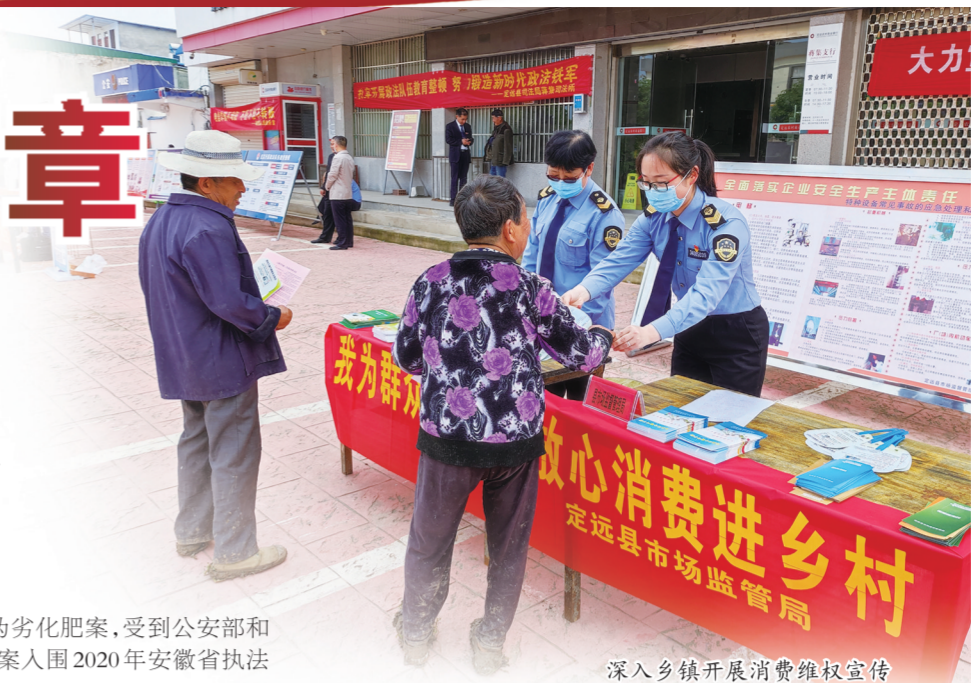
深入乡镇开展消费维权宣传

开展质量基础设施一站式服务,深入推进“计量服务中小企业行”活动,加快省级盐化工质检中心资质申报进