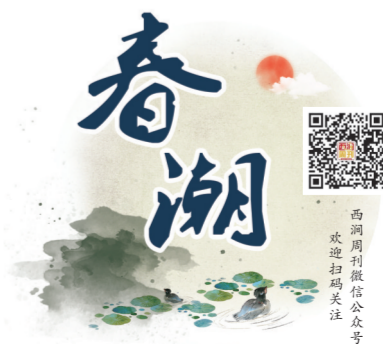
西涧副刊微信公众号

答:欧阳修谪滁,从中央来到地方,其眼界格局非常不一般,他的主张有点像“小政府、大社会”的思想,提倡与民同乐,让百姓修养生息,用文化教化民众,也吸引了众多学生如曾巩等来滁学习。欧阳修给了滁州古代文明灿烂精彩的一页。有了欧阳修,滁州才有了醉翁亭和丰乐亭。滁州是我的家乡,我一直非常关注这里的发展。现在滁州打造“亭城”这个概念非常好,城市处处有亭,造型多样,形态美观,不仅有复古风气,而且有精品意识。除了欧阳修,滁州还有众多的历史文化名人,如果能建一个类似滁州历史文化人物的长廊,为其塑像、陈列事迹,让滁州文化形象更加饱满、丰富,树立大旅游、大历史一体化的观念,可以让更多的游人留得住,让更多的人了解滁州。