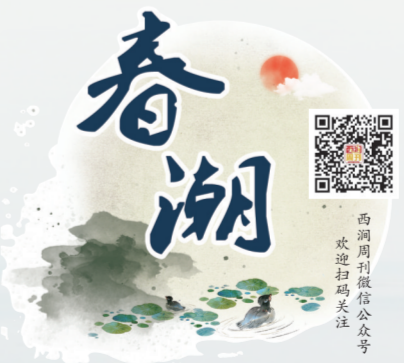
西湖月报微信公众号 欢迎关注

绿色发展理念内涵是丰富的，凤凰山践行绿色发展理念也是一盘大棋局，任重而道远。修好凤凰山不仅给凤阳人营建了休闲娱乐的“后花园”，更有这高洁之音传扬悠远，给这座城市精神滋养，让政治清明，人心纯善。凤凰于飞，如意新城，一片政通人和的景象。