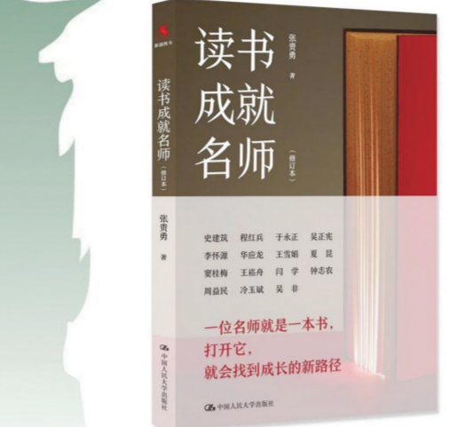
《读书成就名师》张贵勇/著

多少次你告诉自己:以后,我一定要多读书!不过,睡了一觉,我还是没有行动。读了张贵勇老