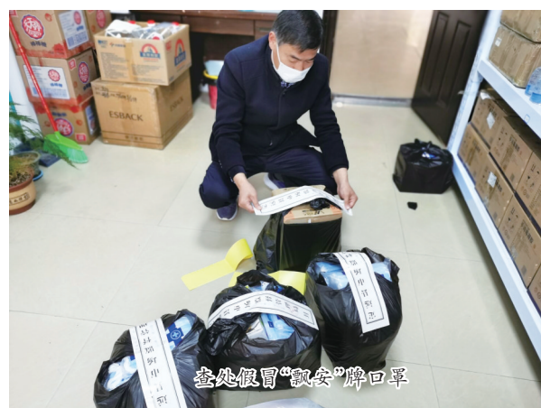
查处假冒“安安”牌口罩

强化疫苗储存和运输监管。对县疾病预防控制中心、27家疫苗接种门诊和5家新生儿首针接种卡介苗和乙肝的医疗机构进行全面监督检查。强化中药饮片检查。对