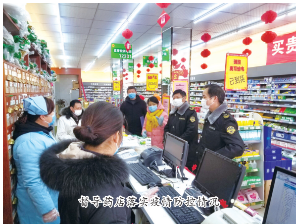
督导药店落实疫情防控情况

近年来,定远县市场监管局在县委、县政府和上级主管部门的领导下,牢固树立以人民为中心的发展理念,坚持打建并举,强化能力建设和舆论宣传,突出重点整治,严厉打击各类涉药械安全违法行为,全面落实部门监管责任,有力维护了全县群众的用药安全。