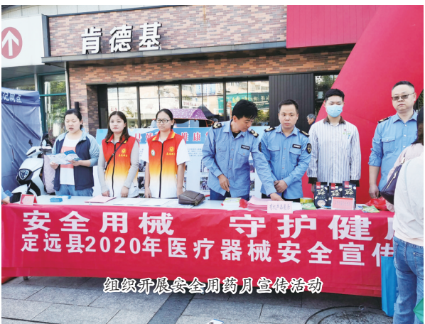
组织开展安全用药月宣传活动

做好药品监督工作不仅需要靠相关工作人员的努力,同样也需要通过相关宣传深入百姓中更加活泛。