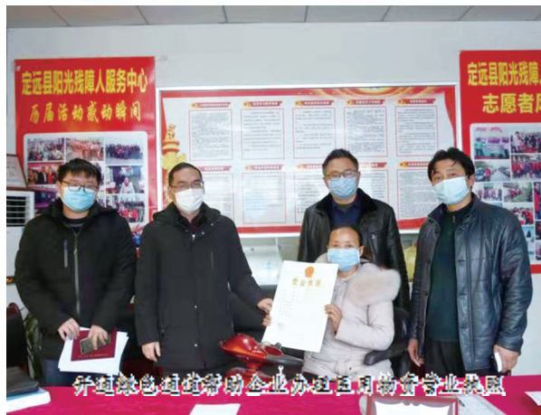
组织县总药械企业办过三月的安全月我

在落实常态化疫情防控工作中,定远县市场监督管理局紧抓后续工作不放松,对公共场合以及相关药品销售工